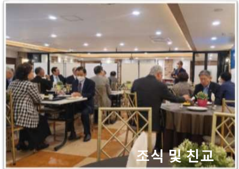
조식 및 친교