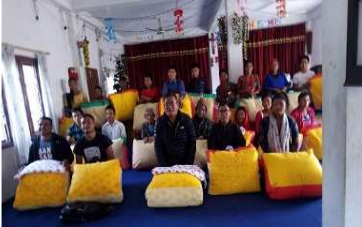
치뜨완 바스거리 교회