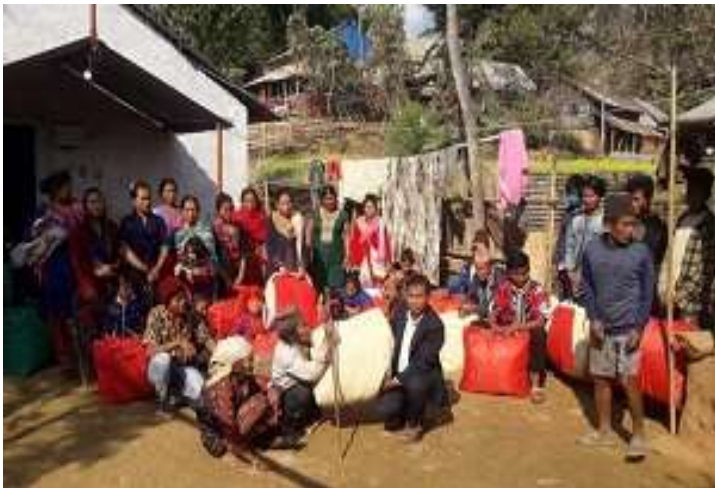
머관뿌르 렉시랑 교회