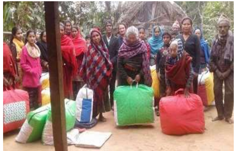
다딩 너망 교회