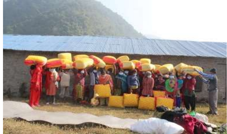
치뜨완 버여우 다라 교회