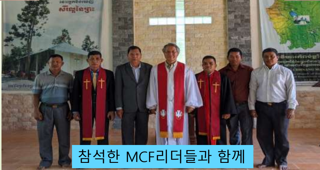
참석한 MCF리더들과 함께