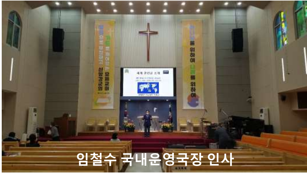
임철수 국내운영국장 인사