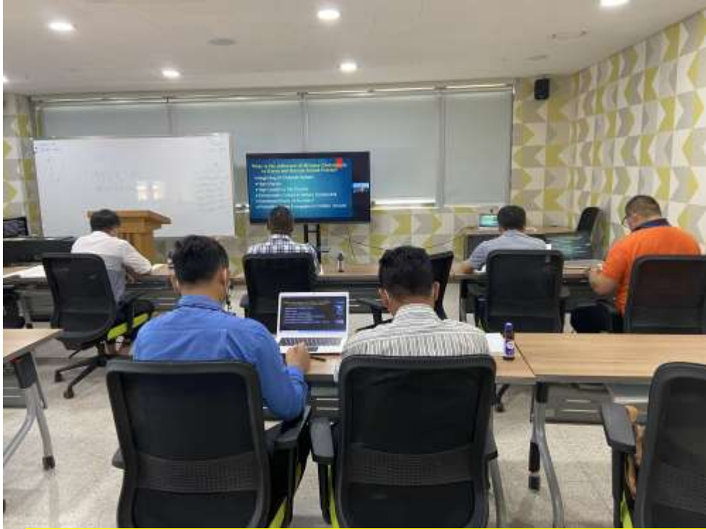
국방대 교회 교육관에서 함께 참가하는 모습