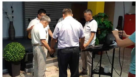
중앙아시아 국가들을 위한 합심기도