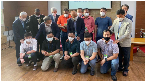
수료자들을 위한 축복기도