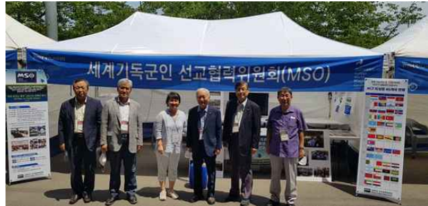
MSO 임원 KVMF대회 홍보활동 참여