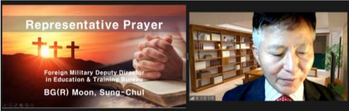
대표기도(문성철 외국군 차장)