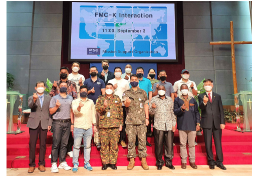
9.3.금.11시 자운대교회 자체수료식