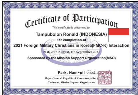
온라인 수료식-육군대학 로날드 소령(인도네시아)