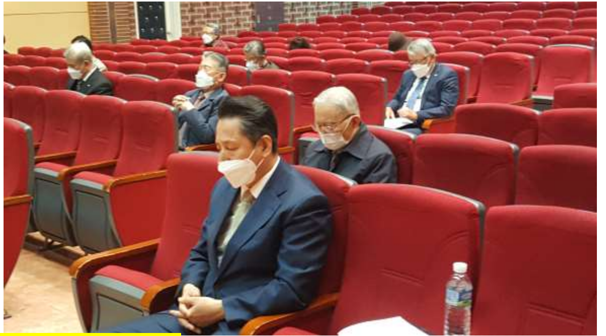
경배 및 찬양, 개회기도, 말씀