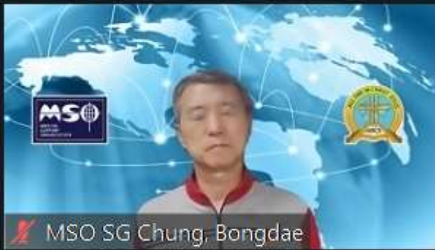
MSO SG Chung, Bongdae