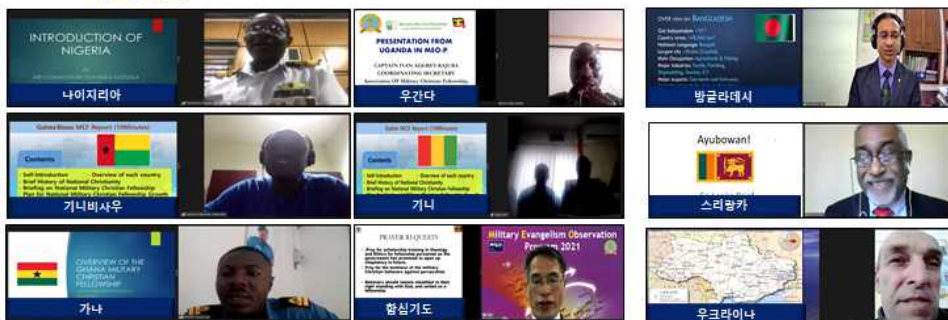
A그룹 국가별 보고