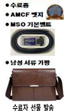
수료자 선물 발송