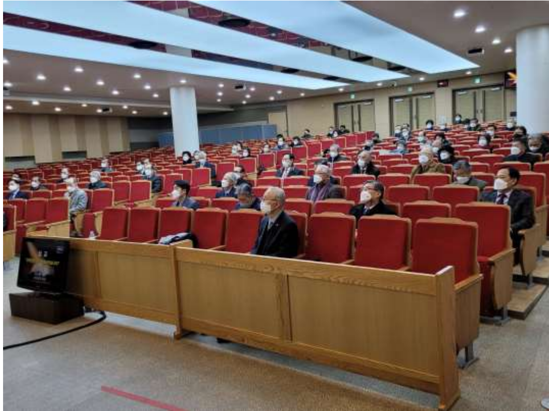
1부 예배, 정기총회 모습