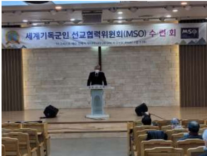
정기총회: 박남필 MSO 위원장