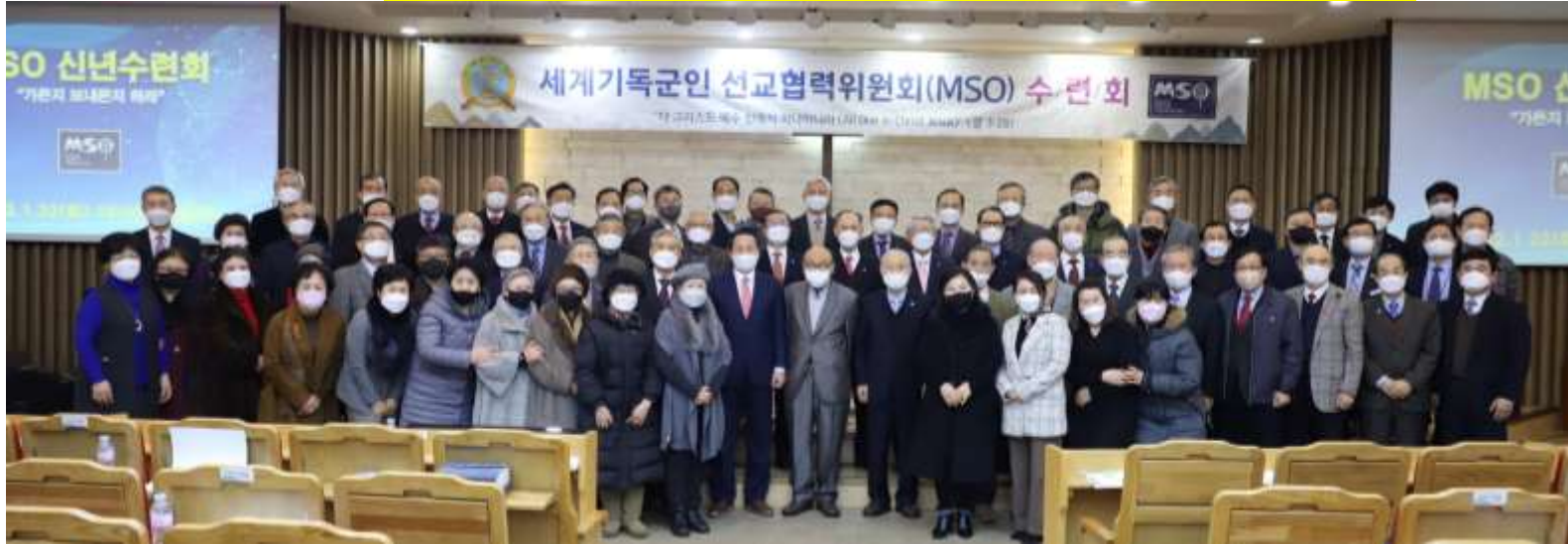
주님의 은혜가 충만한 가운데 멈출 수 없는 사역 모습(MSO 신년수련회)