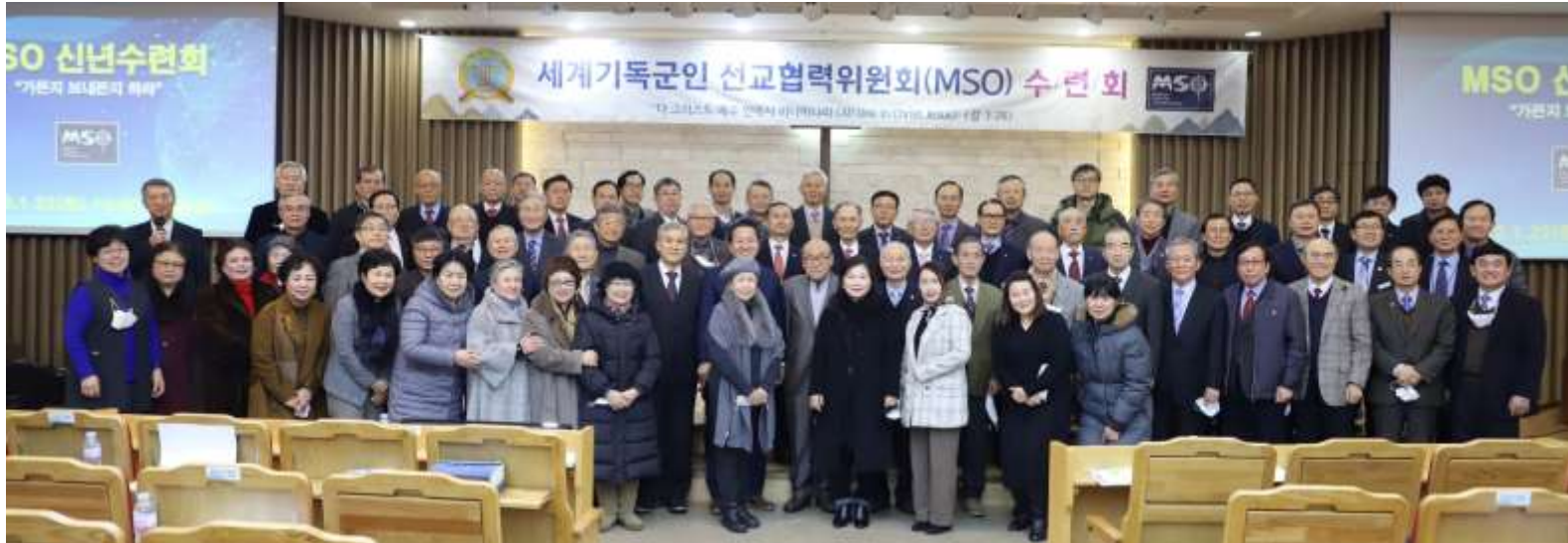
2022년 세계 군선교 사역에 모두가 헌신을 위한 다짐(MSO 신년수련회)