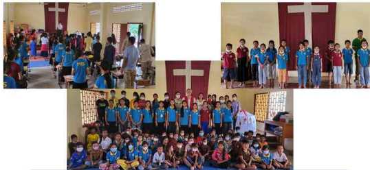
해병국제학교 학생들의 캐롤송 발표, 성탄예배, 친선오찬 및 학용품 수여