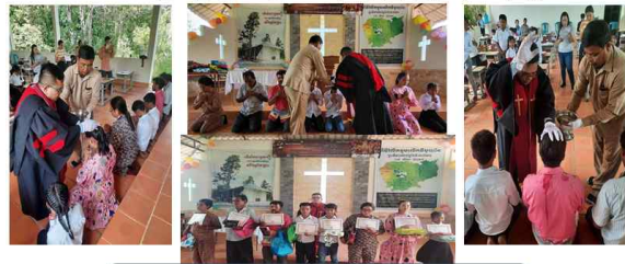
2021년 캄퐁츠낭교회 세례자 총8명(성인 5명, 청소년 3명)