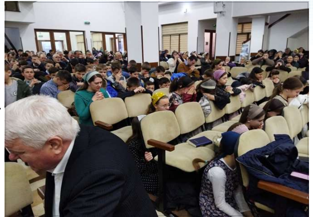
우크라이나 난민과 전쟁종결 위한 무릎기도 (루마니아의 국경 근처 교회)

현재 우크라이나는 1,000만명 이상의 피란민, 3만여명의 사상 장병, 수만명의 민간사상자가 발생하고 있다. 이러한 상황에도 불구하고 우크라이나 군종목사들은 전장에서 병사들의 영혼구원과 돌봄, 군인가족 및 민간인을 위한 복음사역과 인도적 봉사활동을 계속하고 있다. 우크라이나 바실리 군목부장은 군목들을 대표하여 기도와 지원에 대한 깊은 감사를 MSO와 후원교회에 보내면서 우크라이나 전장의 영상사역 모습과 함께 기도요청을 해왔다.