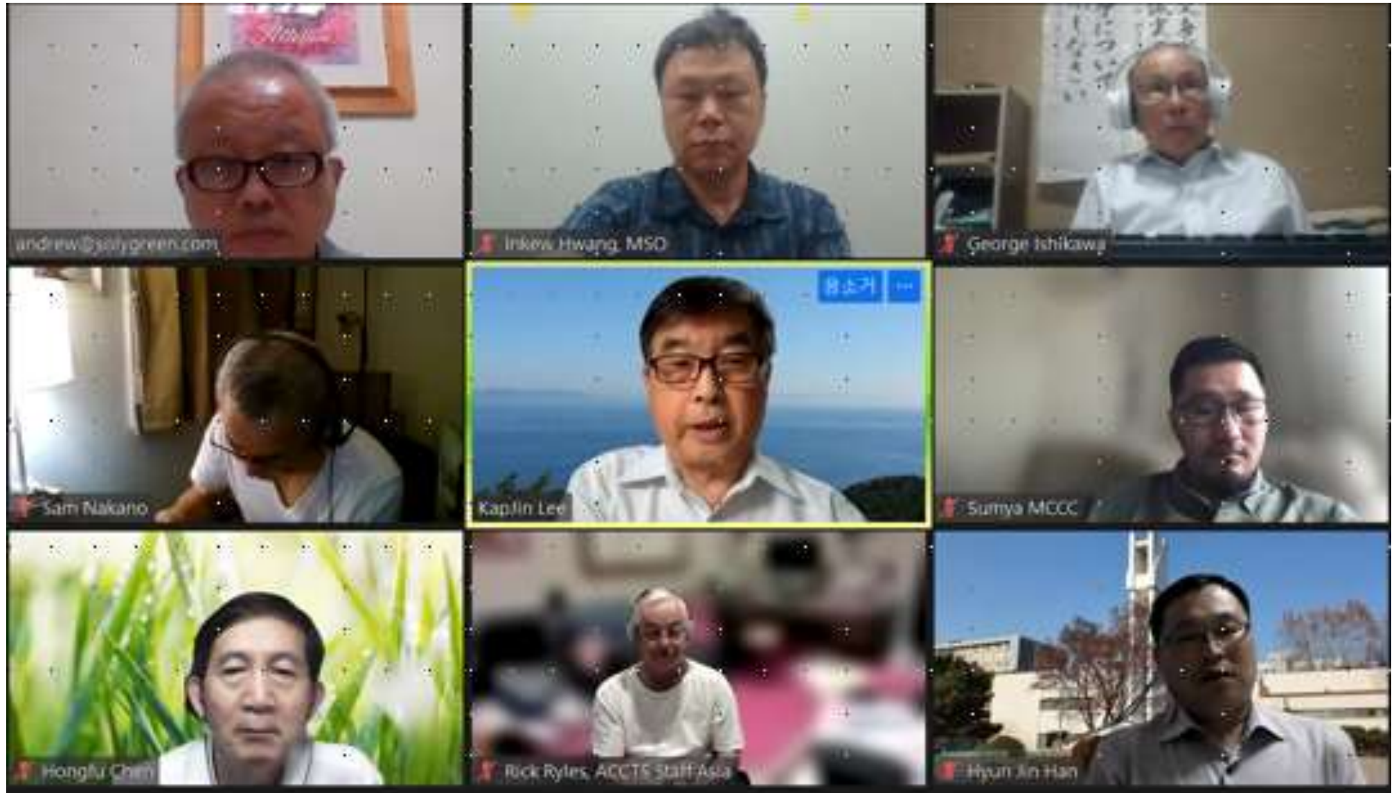
동아시아 인터랙션 회의