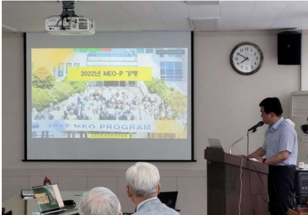
2022년 MEO-P 강평