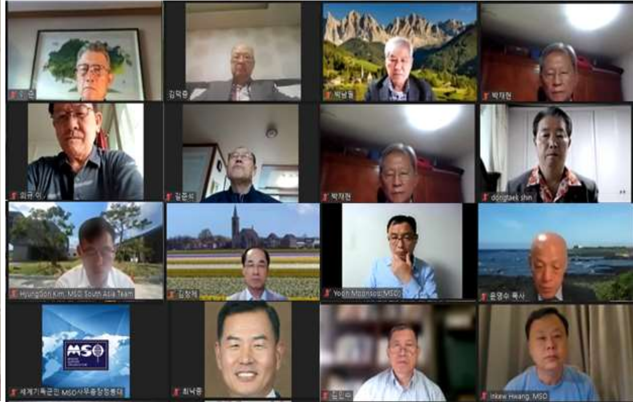
MSO 목요기도회 대면+온라인 실시