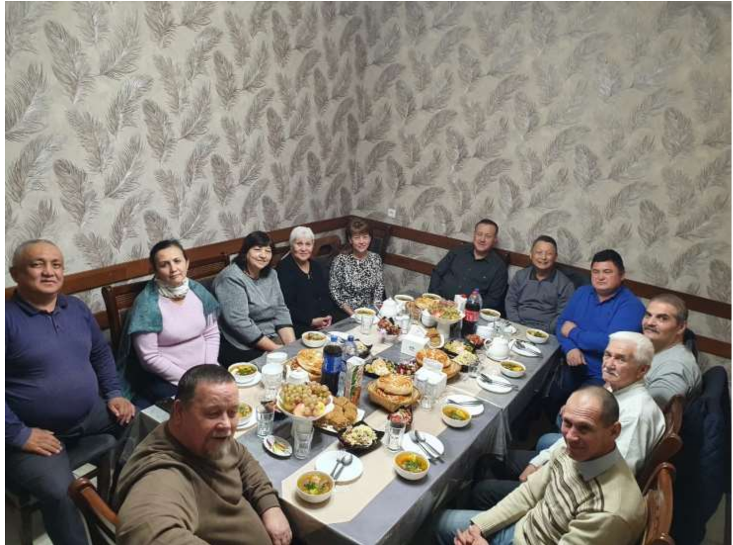
타슈켄트에서 MCF 1일 수련회, MCF/유관교회 방문 친교활동 모습