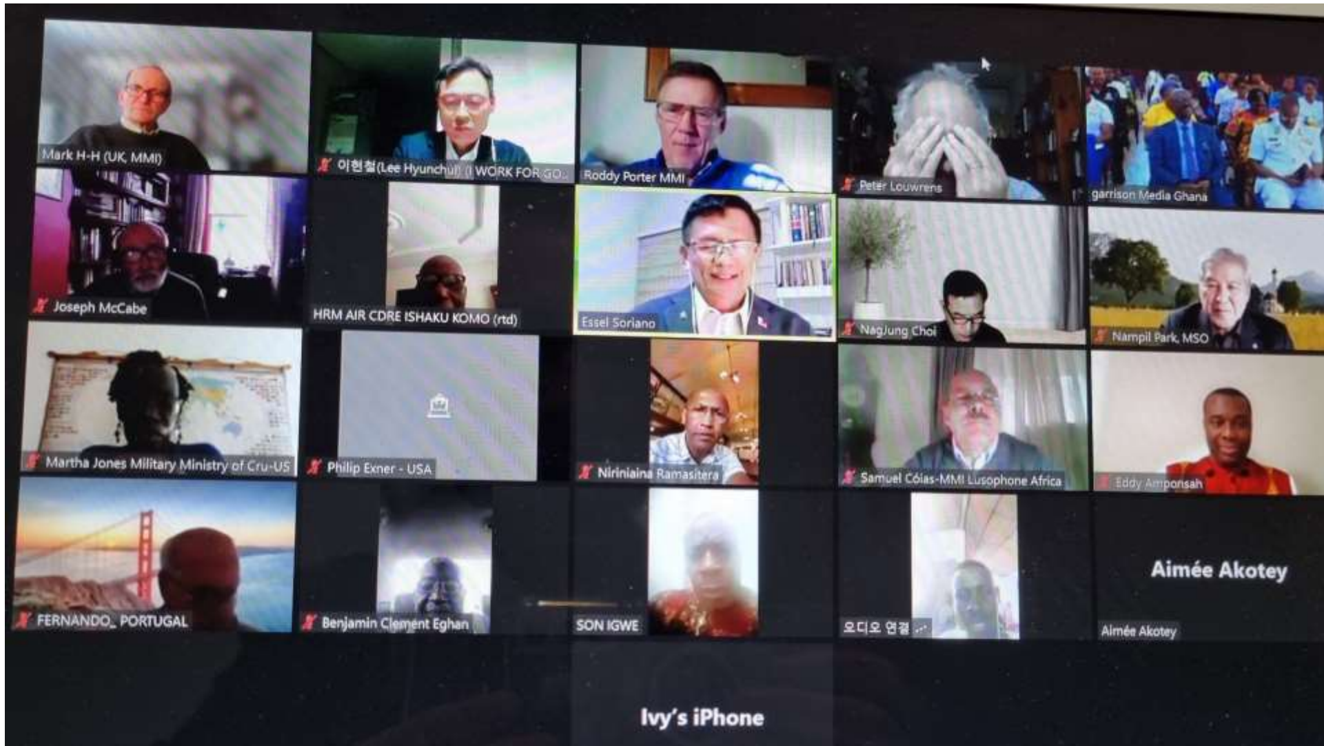
AMCF 서아프리카 부회장 이. 취임식(온라인) 모습