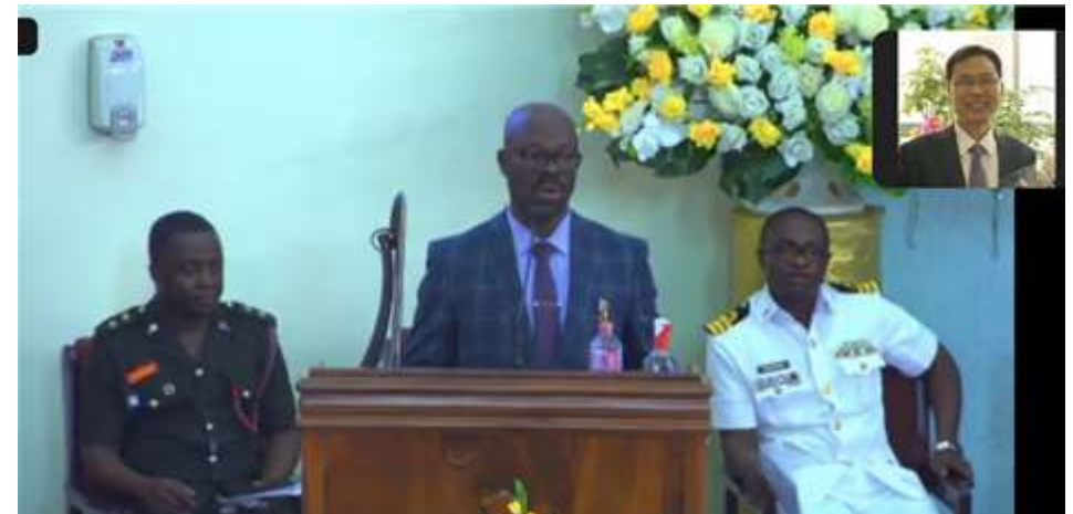
서아프리카 VP 축사(Akpatsu 장군)