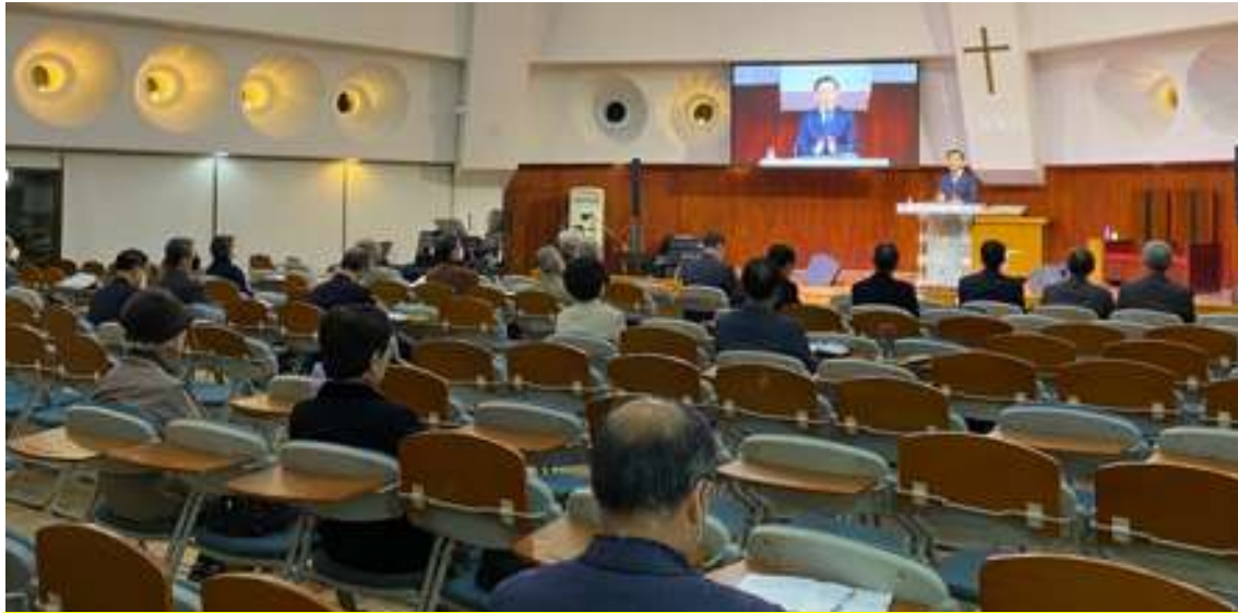
MSO 주간기도회 온누리교회 김홍주 목사 설교(대면)