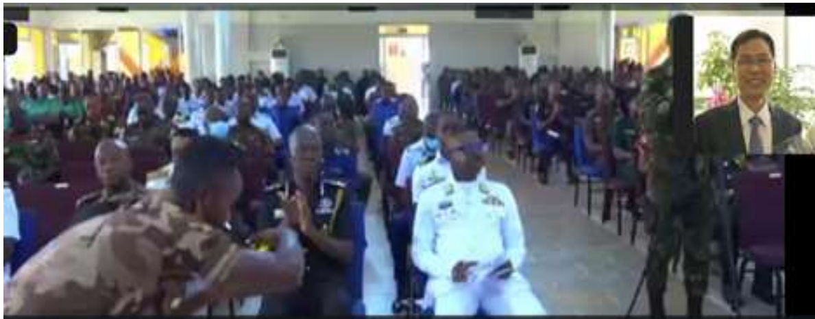
가나 MCF 국가기도회는 대면 및 온라인으로 동시진행