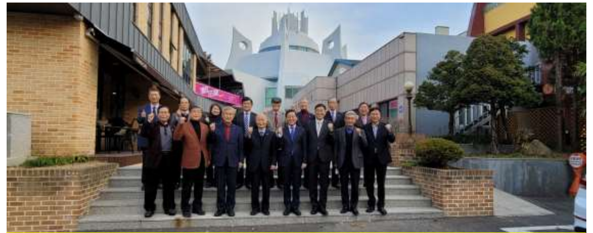
온누리교회 선교임원 내방/MSO 임원