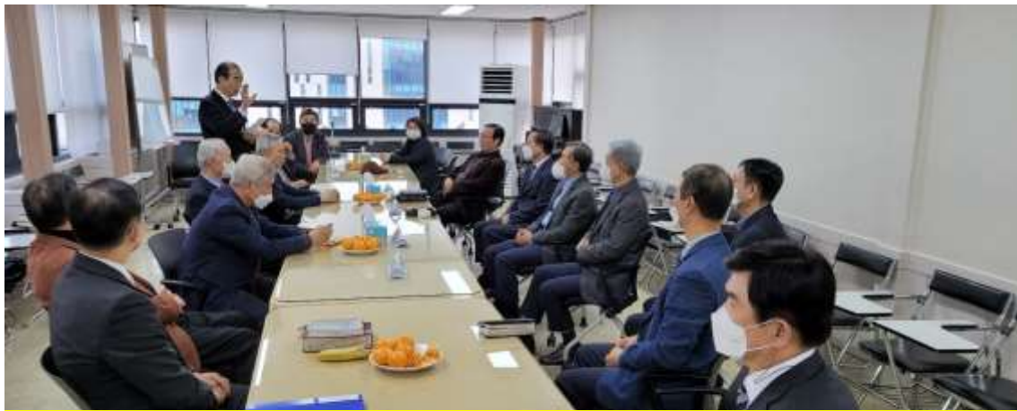
세계 군선교 전략토의(온누리교회 선교임원/MSO)