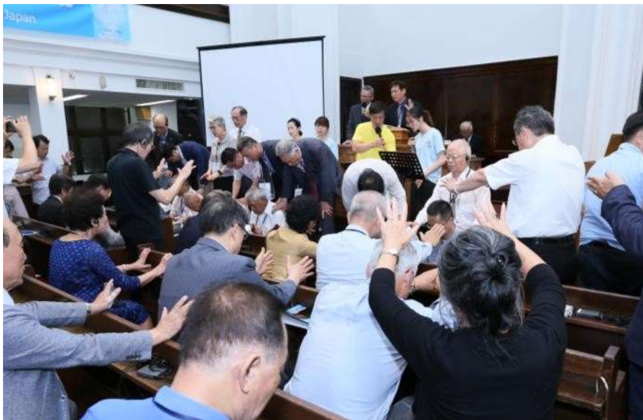
일본자위대 대원들의 크리스천 모임(고넬료회) 모습