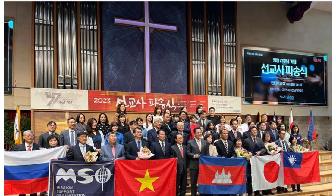
신길교회 파송 선교사와 후원가정의 모습