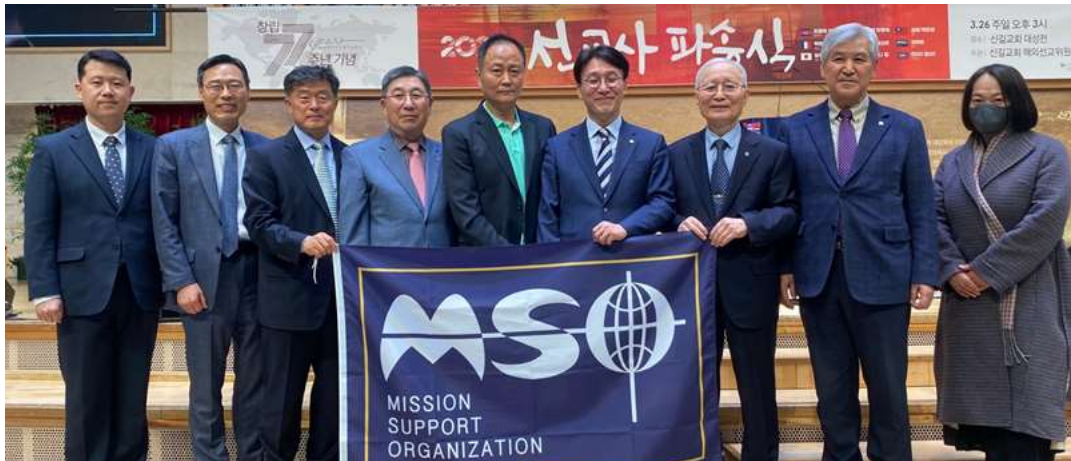
신길교회 후원가정과 MSO 임역원과 함께)