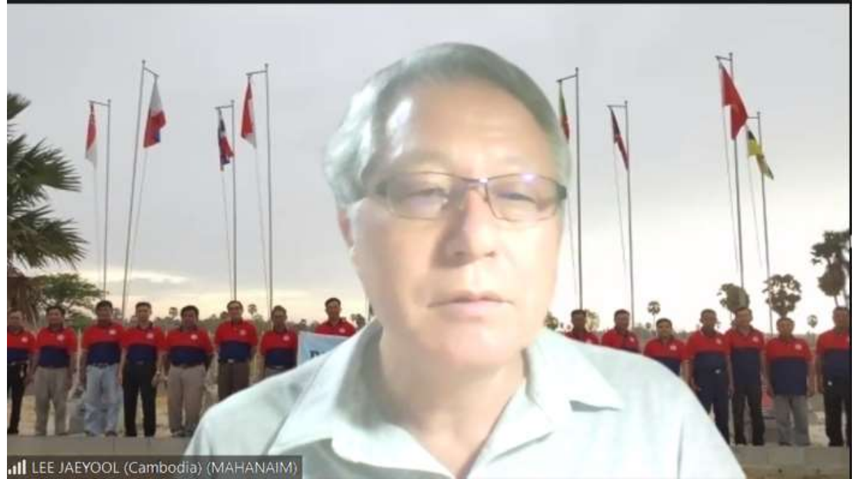
캄보디아 현지에서 온라인으로 사역결과 보고하는 MSO 사역선교사 모습