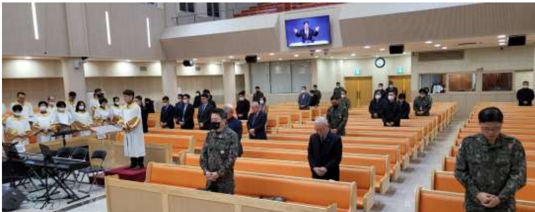
KVMCF/KMCF 연합조찬예배 모습