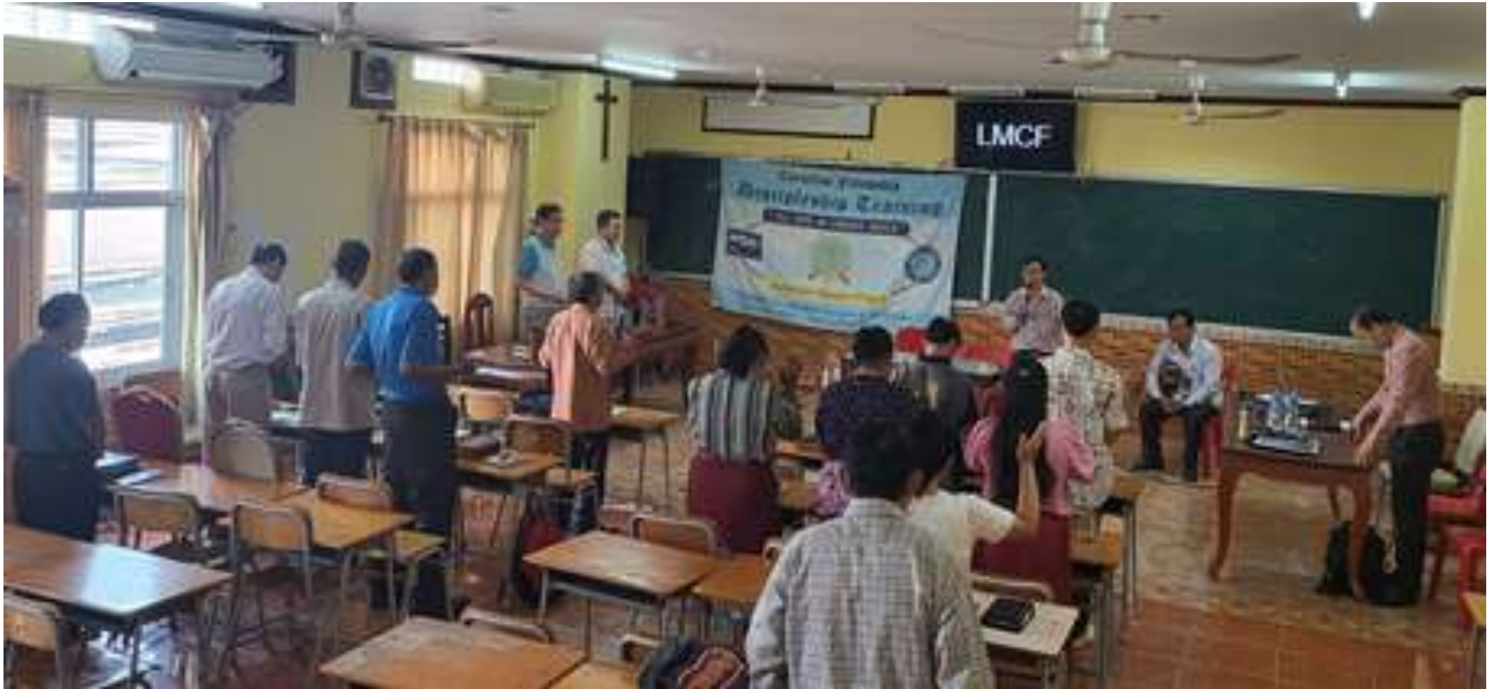
라오스 MCF 고벨료 제자훈련 첫날 개회예배 모습