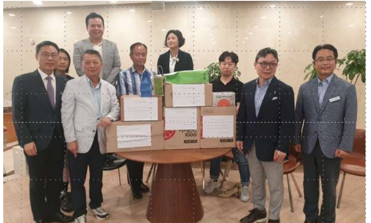
신길교회 해외선교협력위원회 모음활동으로 비타민 전달