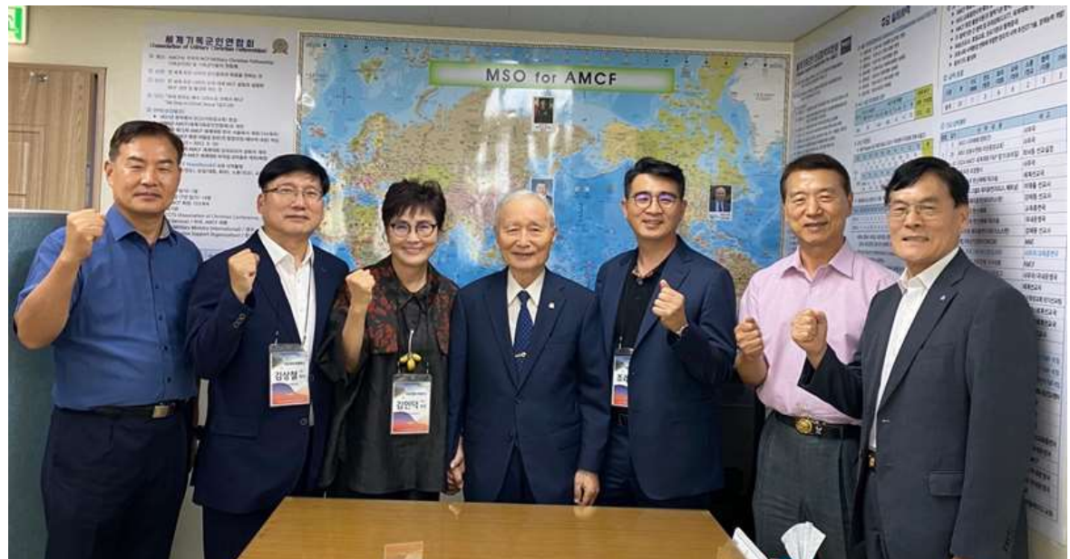
World K-POP Center/ 병영문화네트워크 대표단 MSO 내방