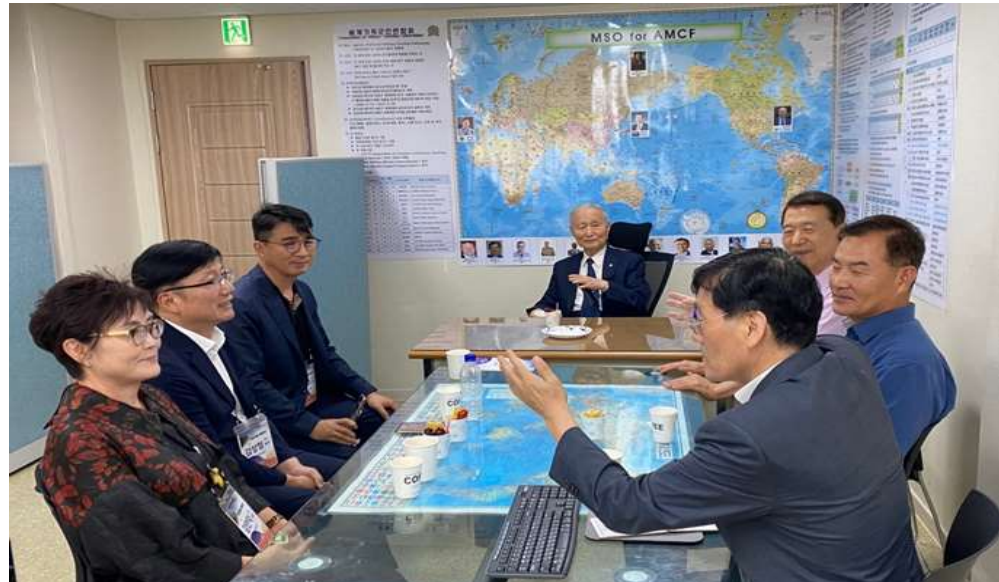
AMCF/MSO소개, 문화콘텐츠를 사용한 세계군선교 사역협력방안 논의