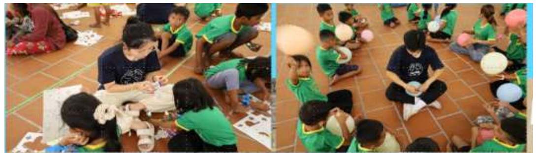
오늘 배운 말씀을 가지고 교사들과 함께 만들기 실습