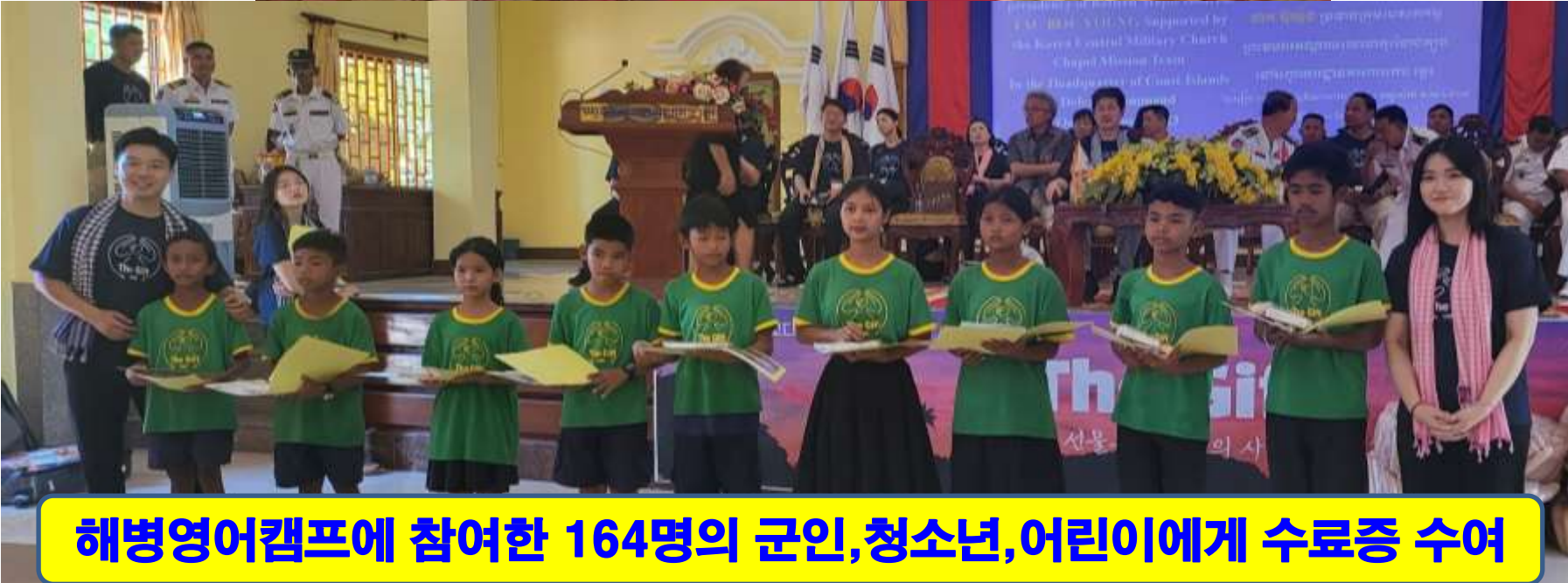
해병영어캠프에 참여한 164명의 군인, 청소년, 어린이에게 수료증 수여