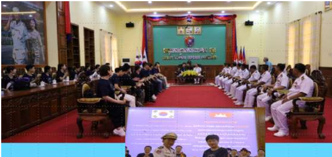
환담 및 친교