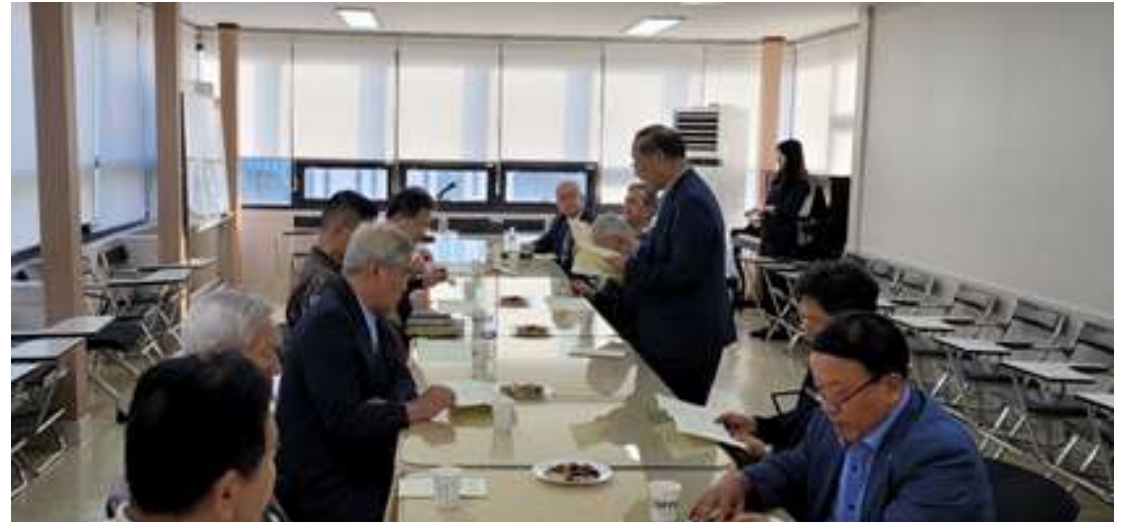
군선교 유관기관 주요활동 보고