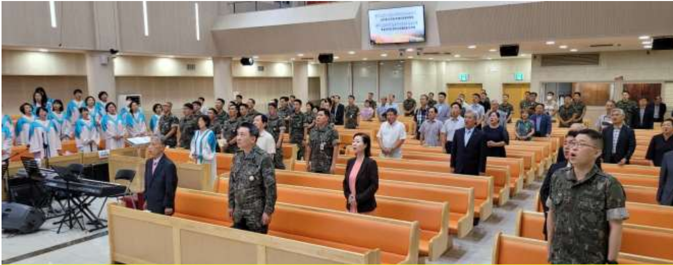
KVMCF/KMCF 연합조찬예배 모습