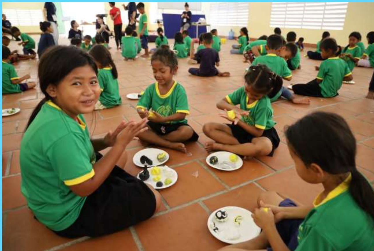
처음 만져본 찰흙으로 하나님께서 창조하신 피조물 만들기