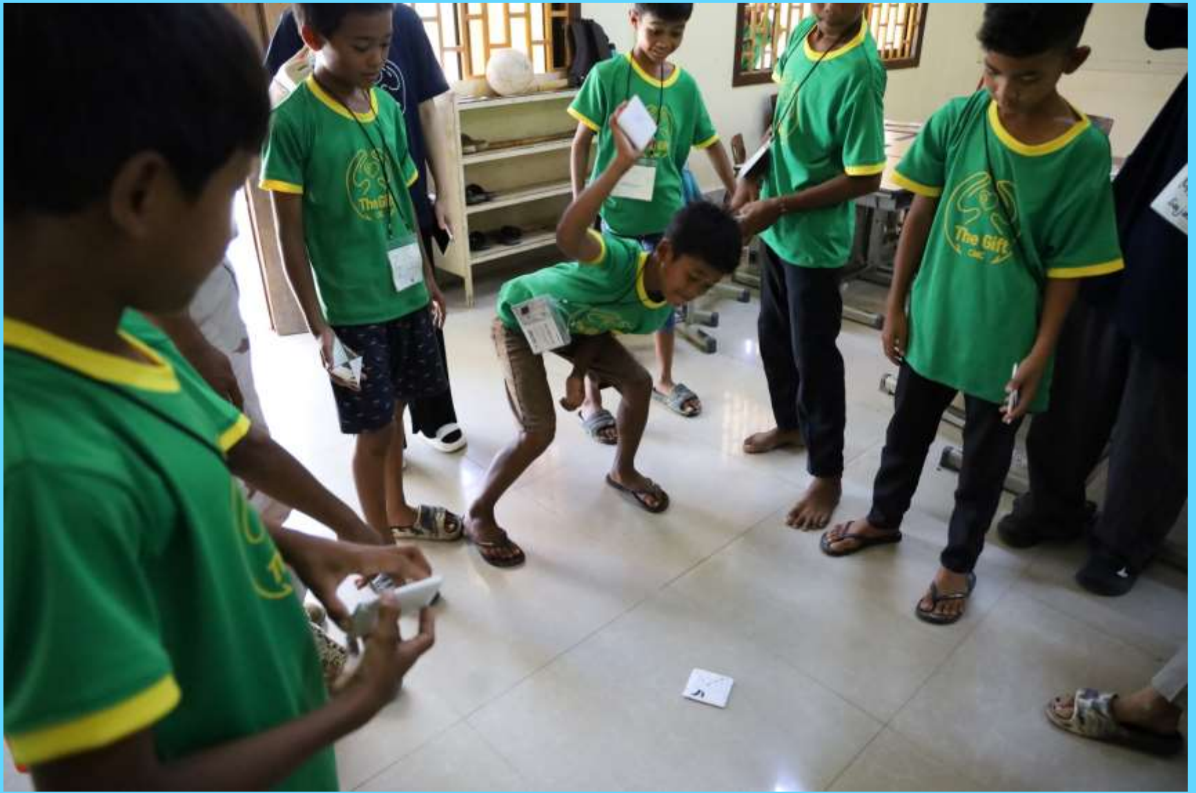
한국 어린이 놀이 (딱지치기)