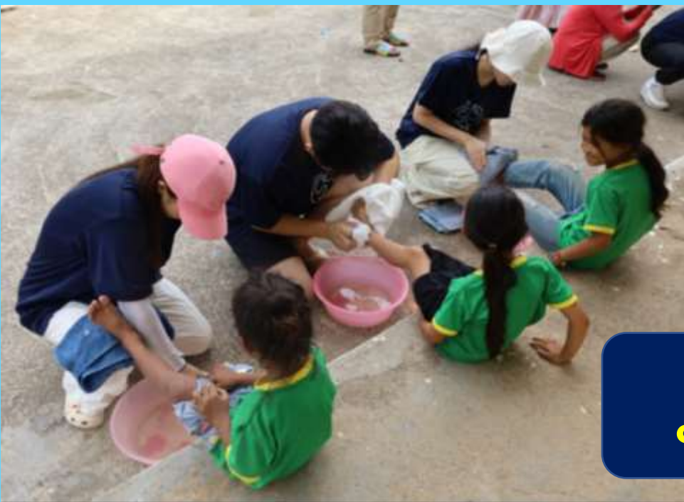
예수님 사랑의 실천으로 어린이의 마음을 울린 세족식