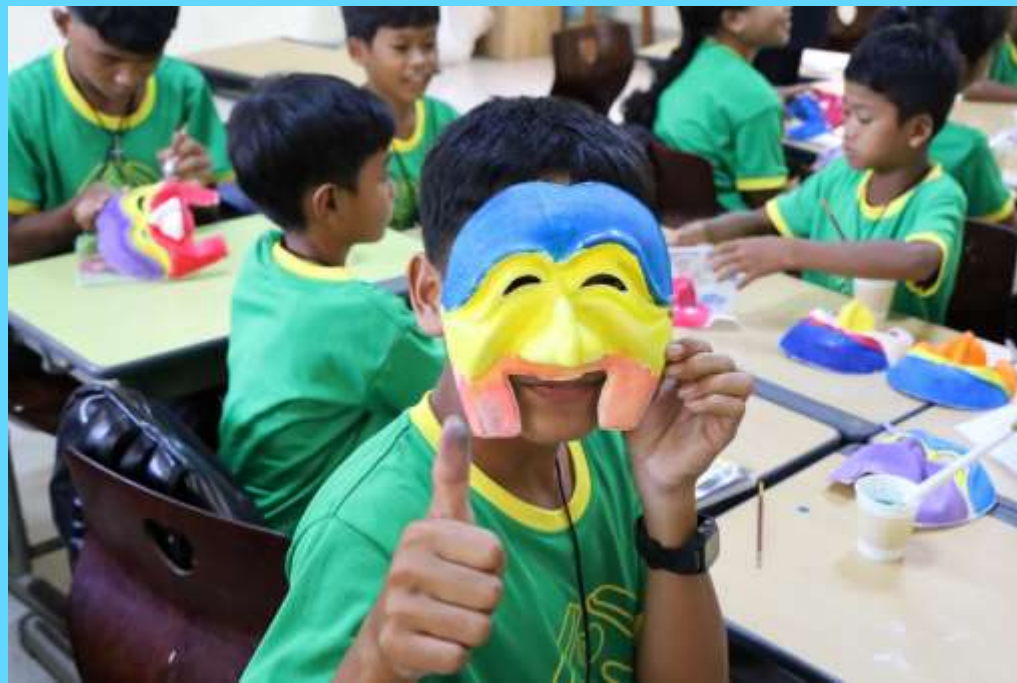
한국 전통문화 체험 (가면 탈, 장구 만들기)