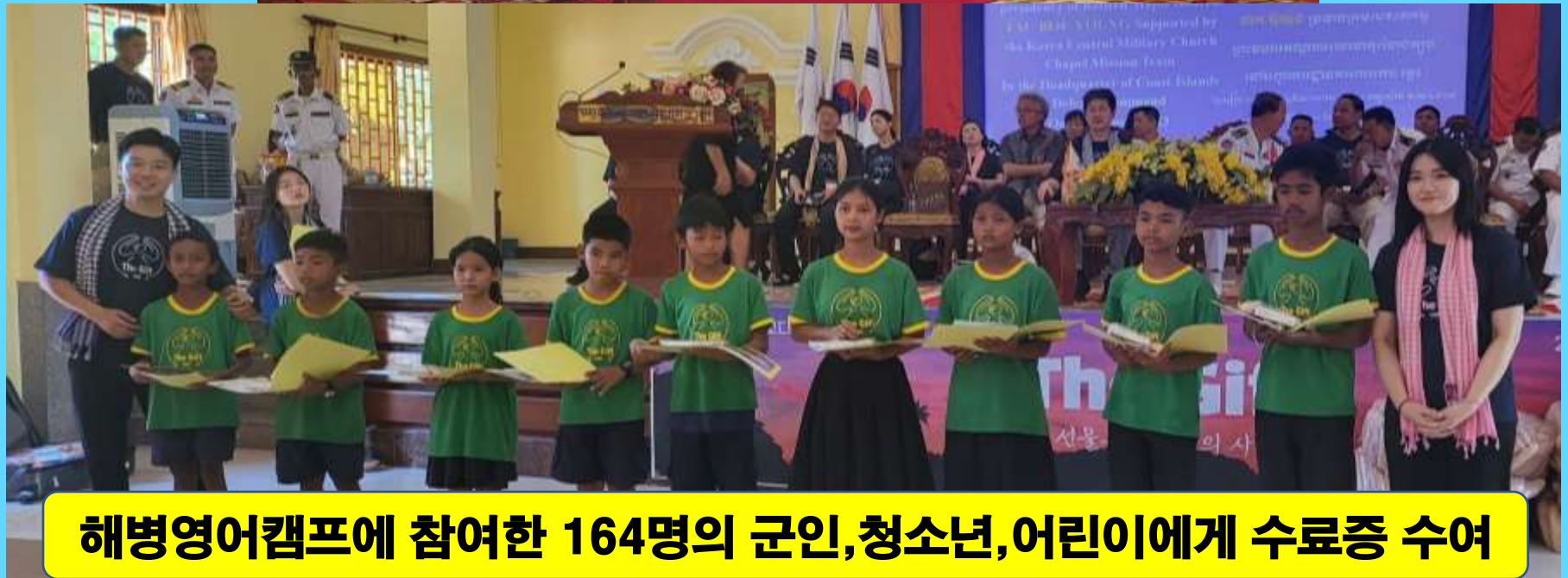
해병영어캠프에 참여한 164명의 군인, 청소년, 어린이에게 수료증 수여