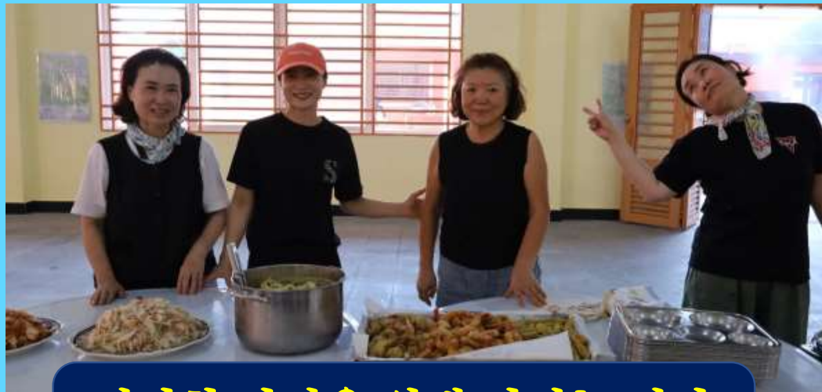
건강한 사역을 위해 맛있는 식사 준비로 수고한 주방팀