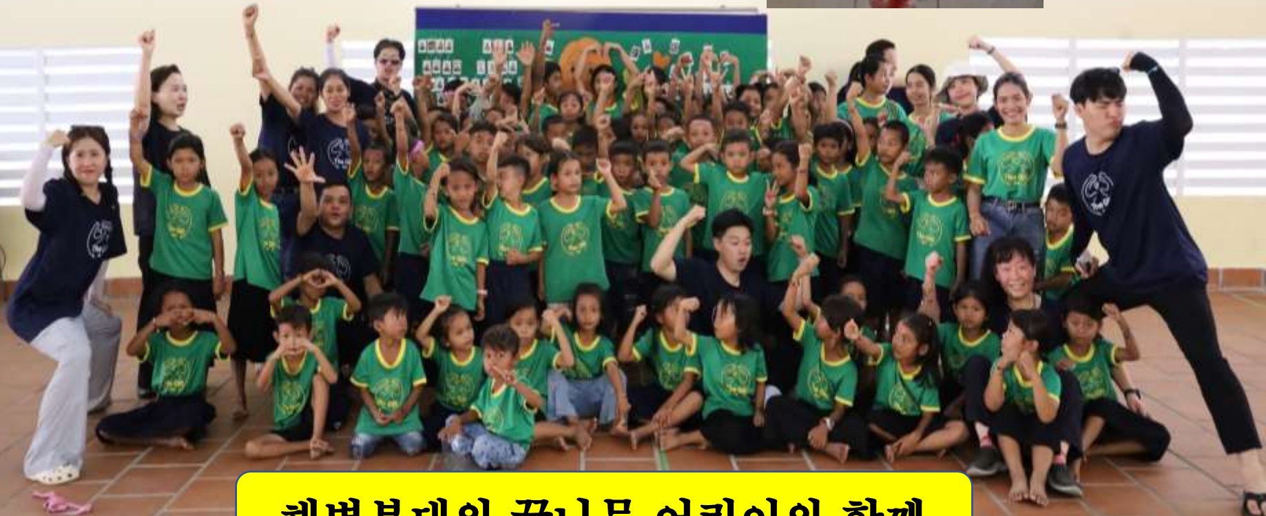
해병부대의 꿈나무 어린이와 함께