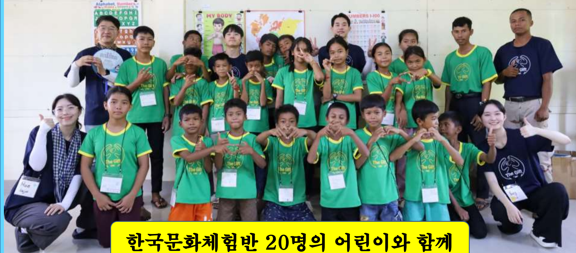
한국문화체험반 20명의 어린이와 함께