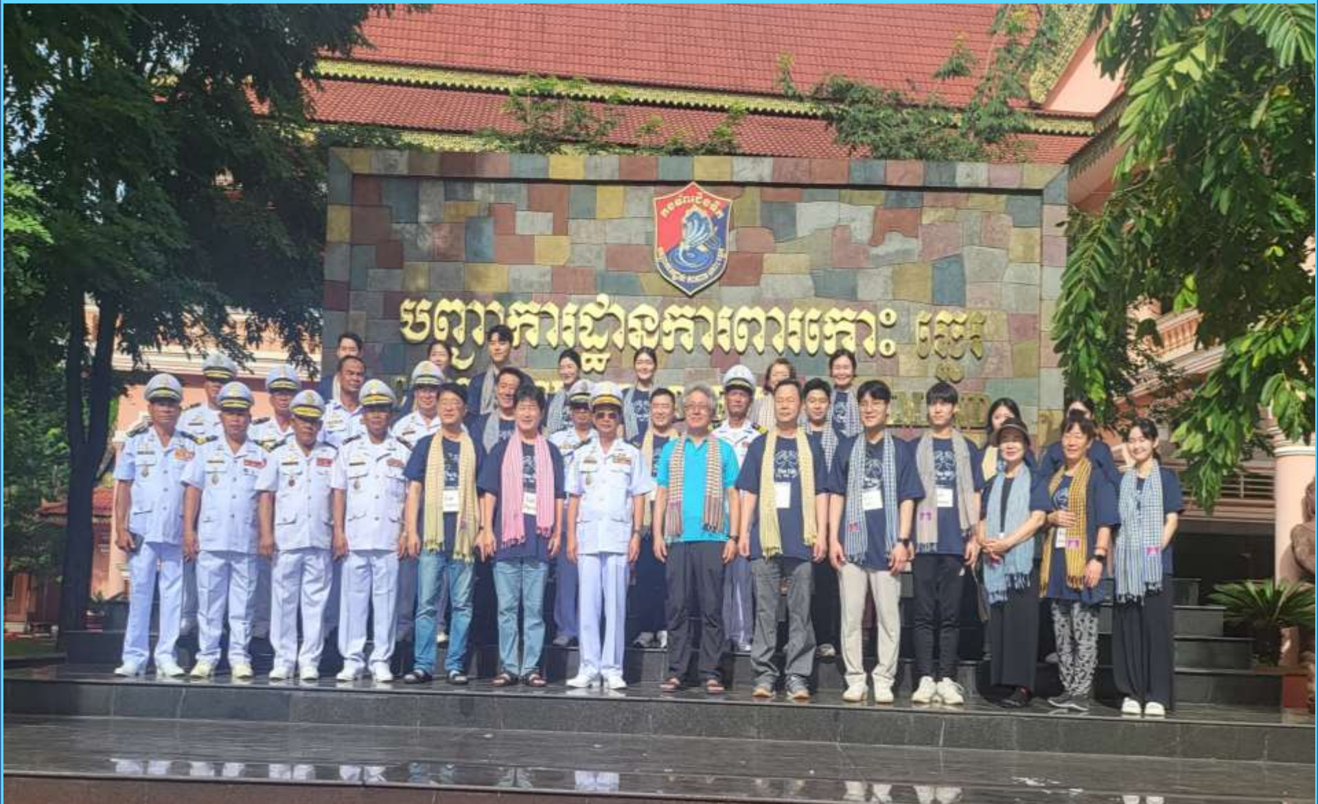
해병부대장과 선교팀 환담 후 기념촬영