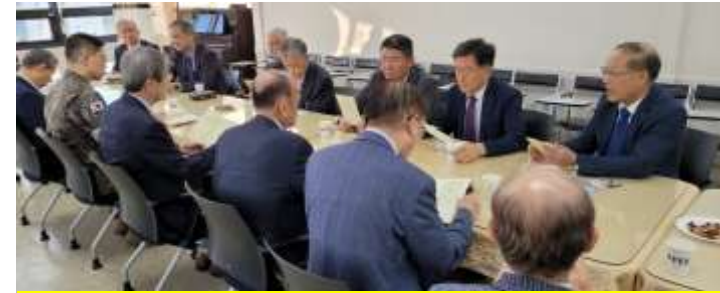
군선교유관기관 대표자 회의