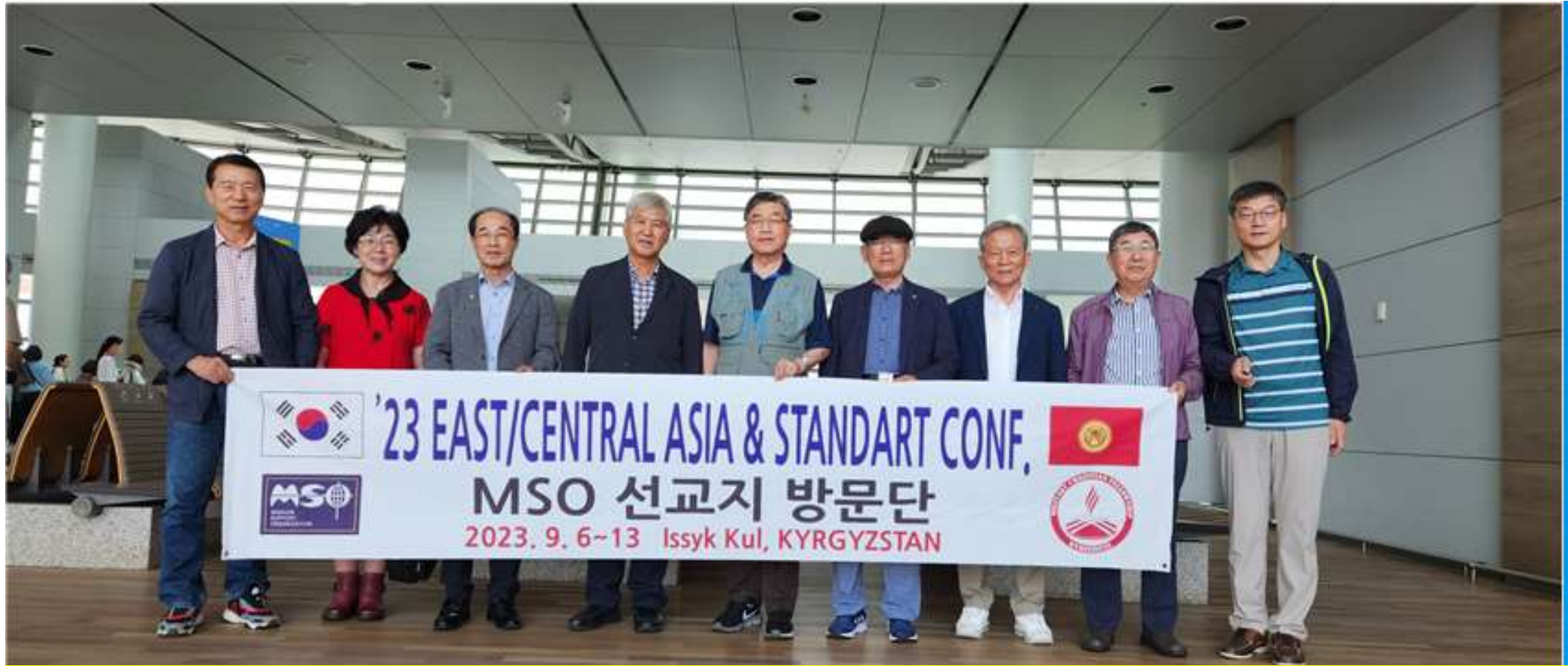
동중아시아+Stan-Dart 대회(키르기스스탄) MSO참가자 인천공항 출발전 모습