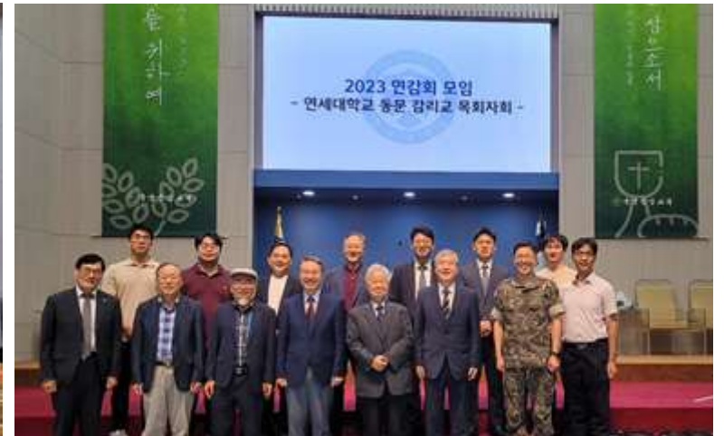
연세대학교 동문 감리교 목회자회와 함께