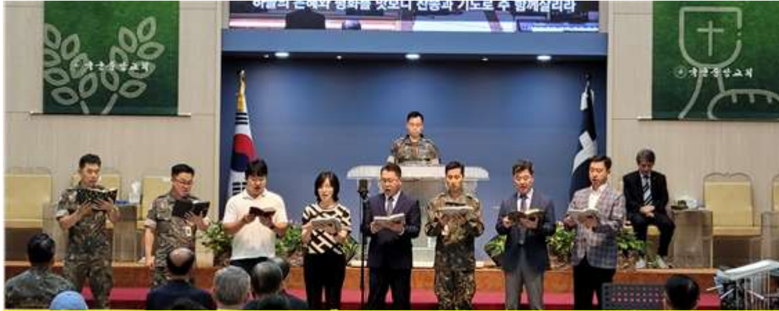
공군 서울지구 기독교인회 특별찬양