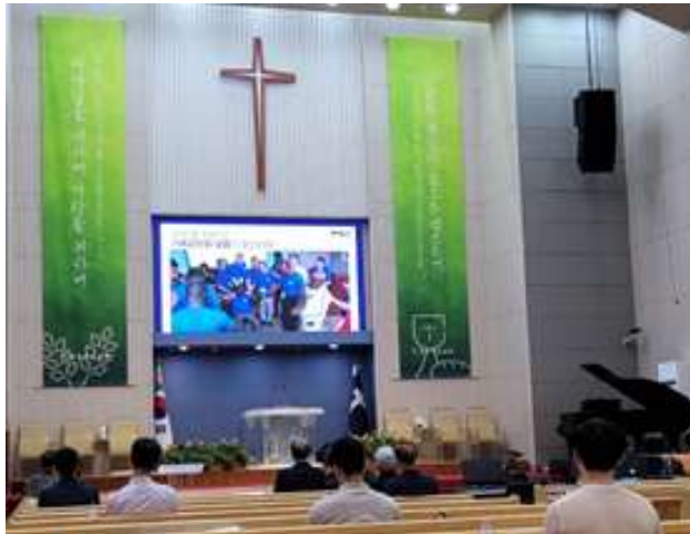
MSO 소개 영상