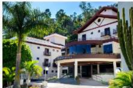
Hotel Recanto Bela Vista