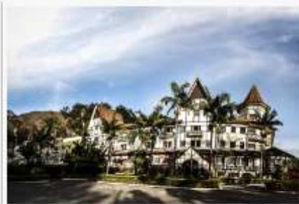
Grande Hotel Glória