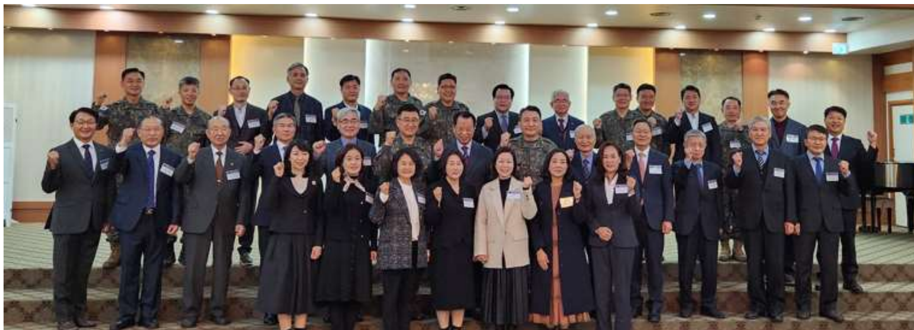
KMCF 회장 환송 / 환영 오찬, 군선교 유관기관 대표 상견례