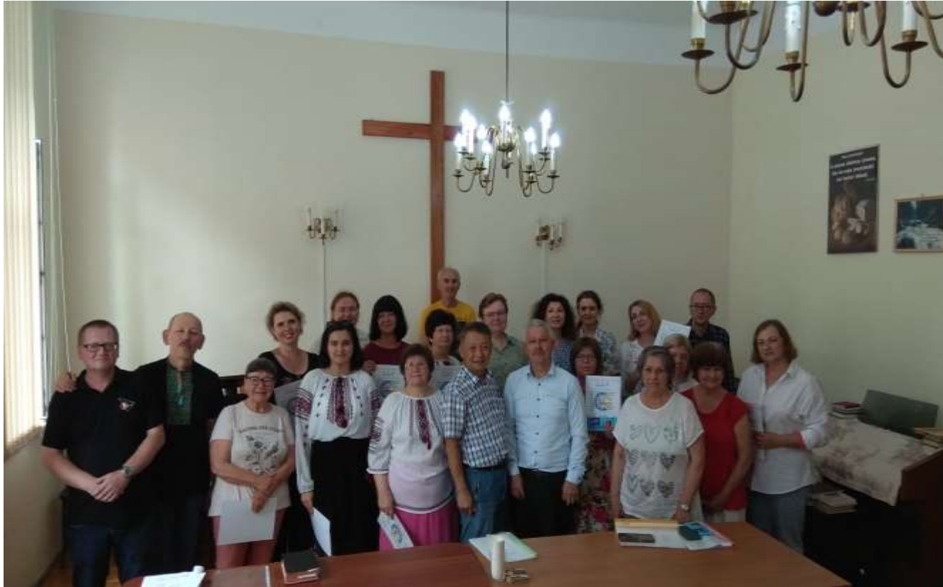
쉐미즈 위로 학교