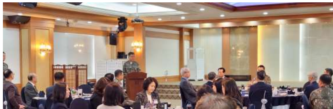
취임인사 제35대 KMCF 회장 육)대장 육군참모총장 박인수 안수집사