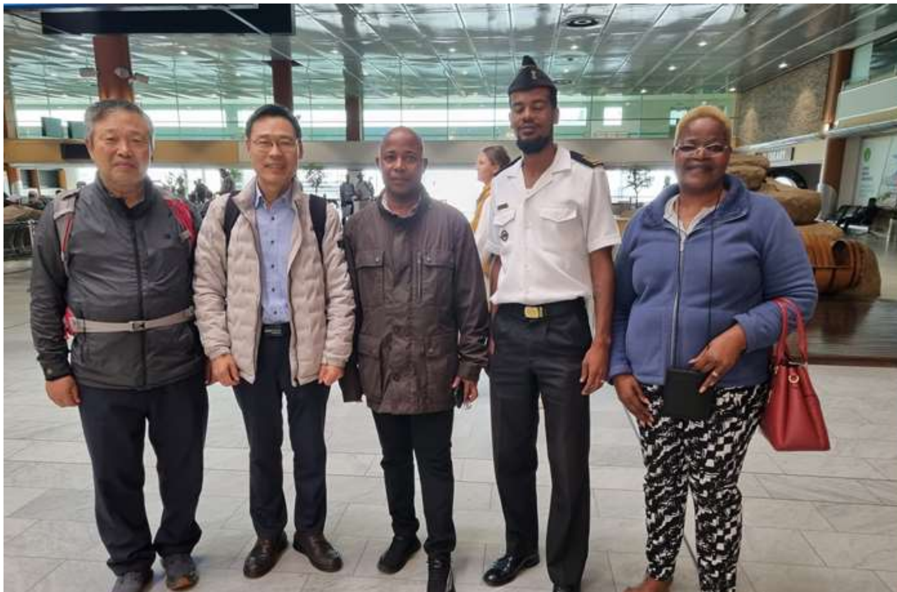
TMTI 참가를 위해 남아프리카공화국 케이프타운 도착