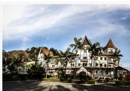
Grande Hotel Glória