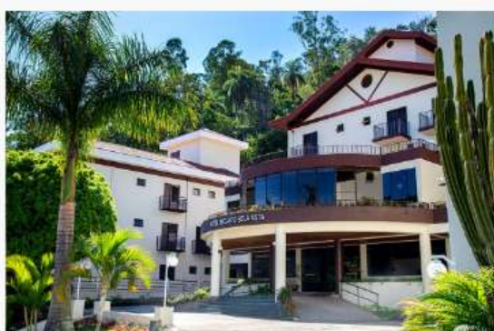
Hotel Recanto Bela Vista