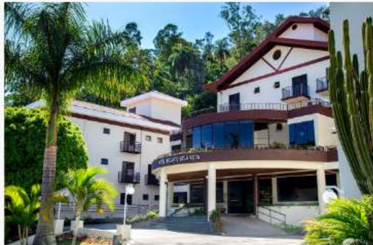
Hotel Recanto Bela Vista