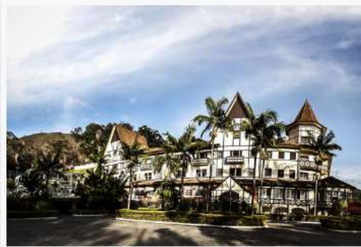
Grande Hotel Glória