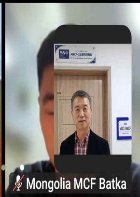
Mongolia MCF Batka