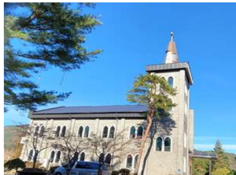
설악 영락교회(주일예배) 7.14 일 08:00~09:00