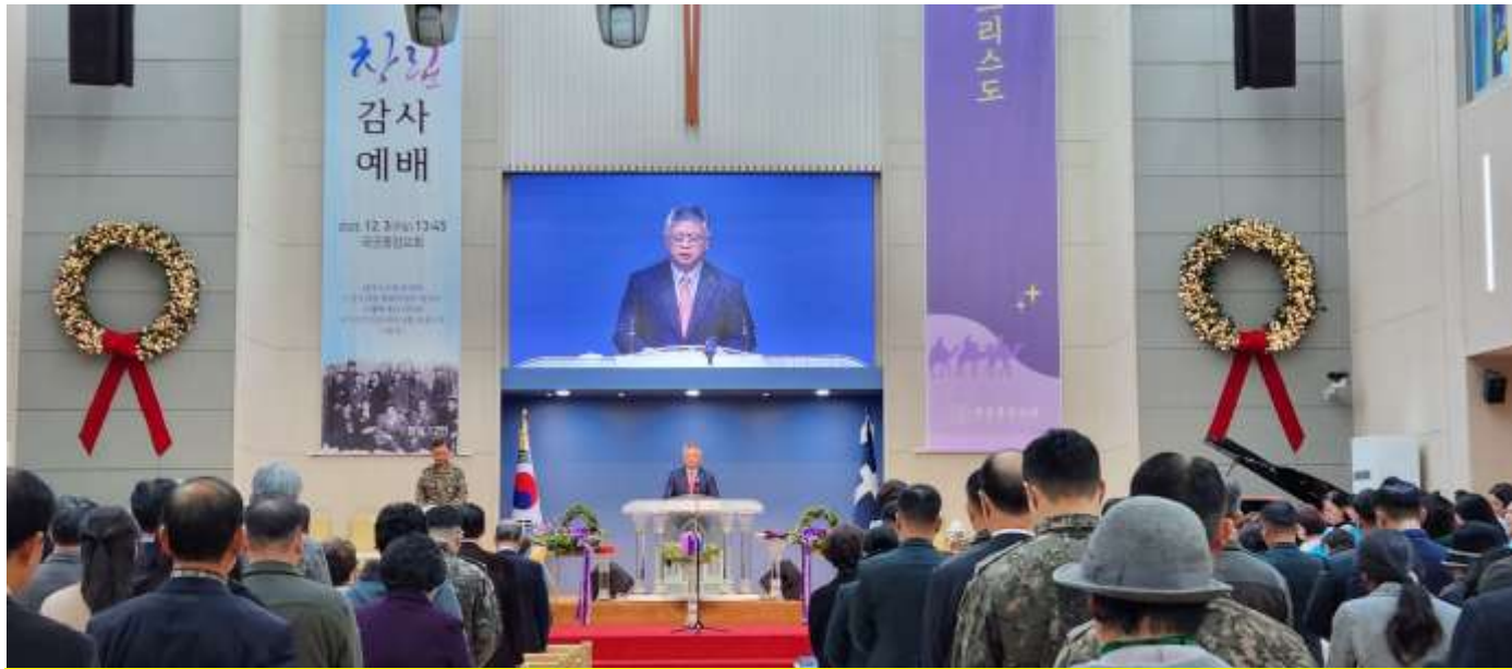
한국기독교군인연합회(KMCF) 창립 67년 감사예배 모습