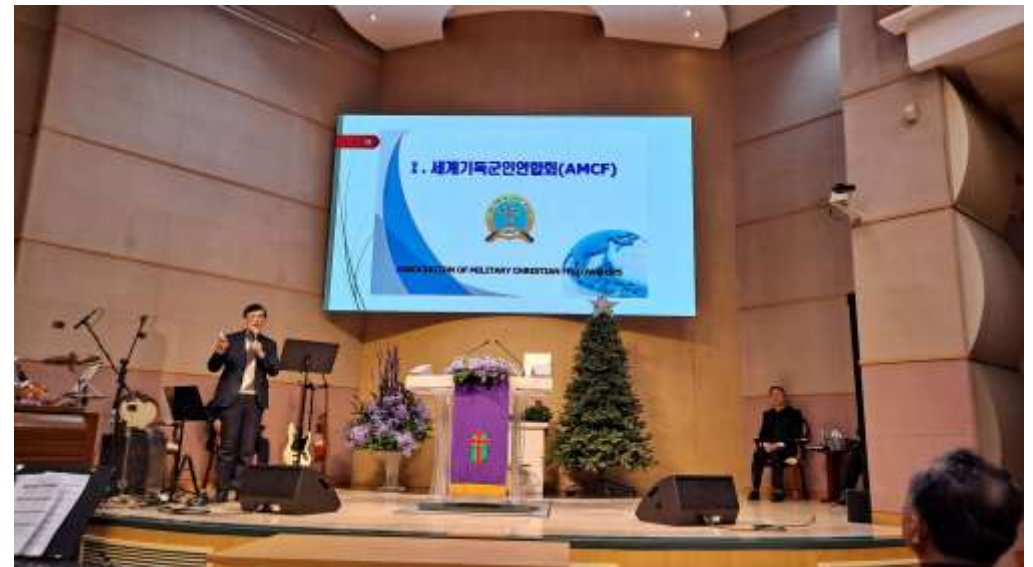
일산총신교회 한밤의 기도회에서 군선교 및 세계 군선교 사역활동 보고 및 합심기도