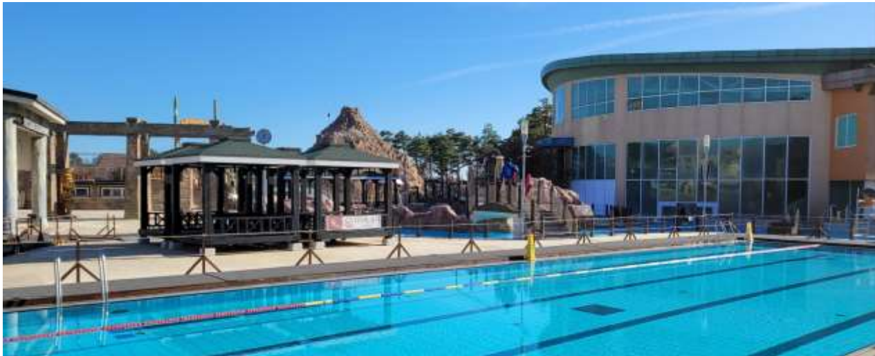
한화리조트 설악 워터피아 (7.13.토. 15:00~18:00), 참가자 수영복 필요