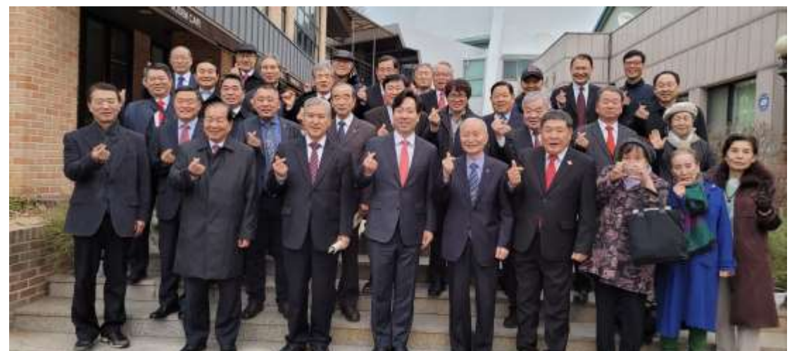
군선교 유관기관 대표자와 선한목자교회 방문단