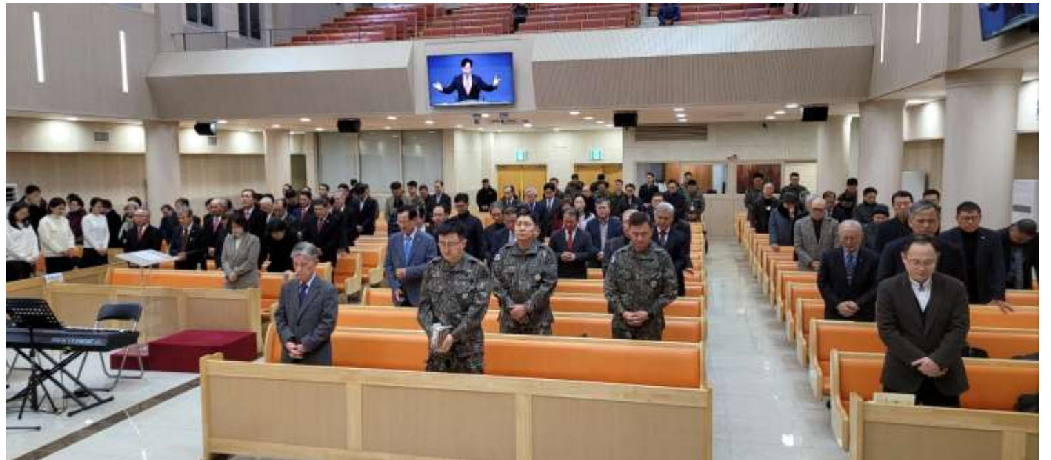
하나님을 위하여, 나라를 위하여, 군을 위하여 합심기도