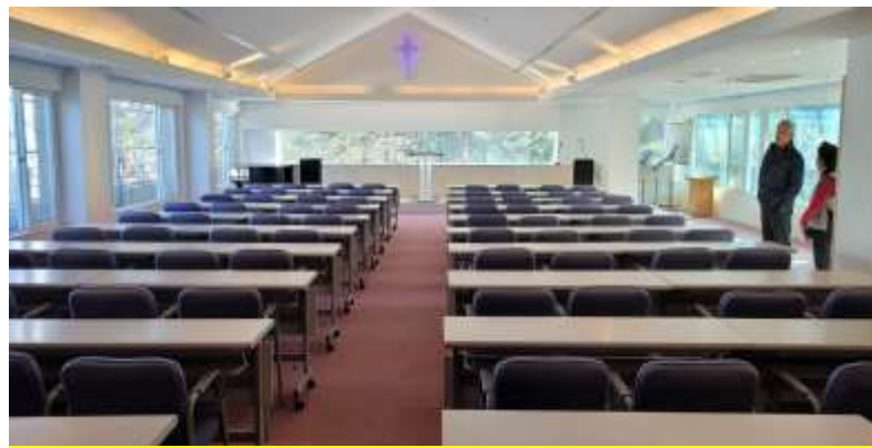
평화홀 세미나실(교육 및 수료식)