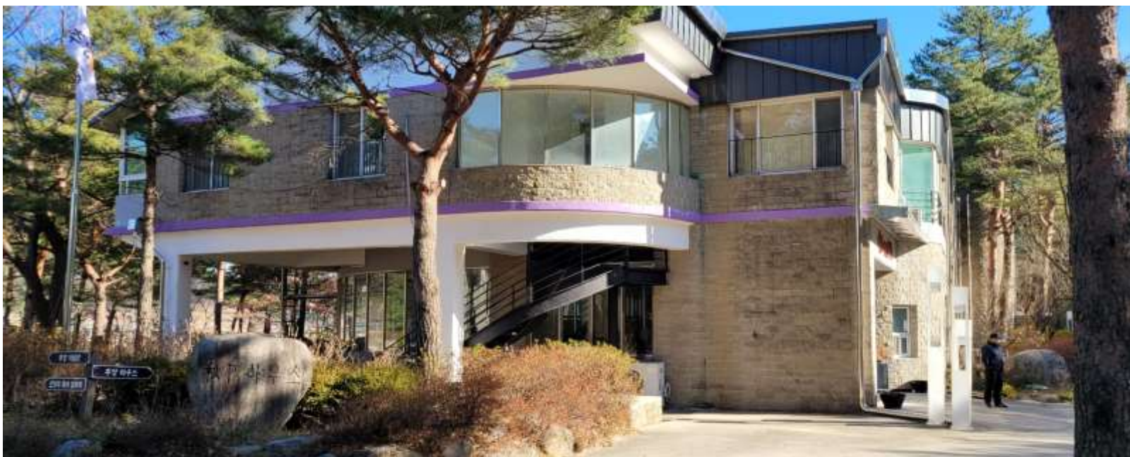
영락교회 추양하우스 전경(숙박 7.12 금, 7.13 토)