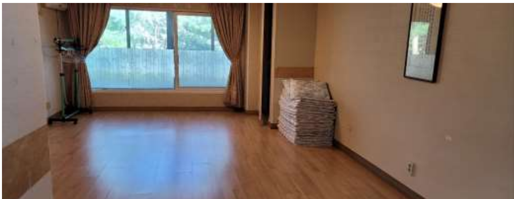
추양하우스 객실(4인실, 6인실, 10인실)