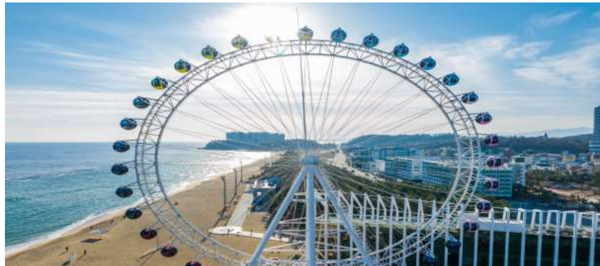
중식, 속초아이 대관람차(7.14.일. 13:00~17:00)