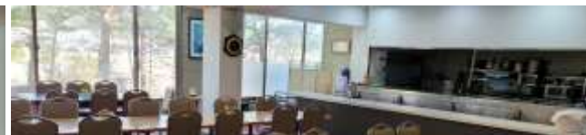
식당 (7.13 토 조식,중식,석식 7.14 일 조식)