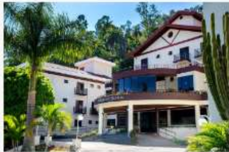
Hotel Recanto Bela Vista