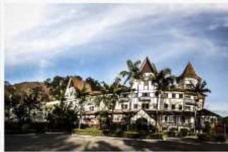
Grande Hotel Glória