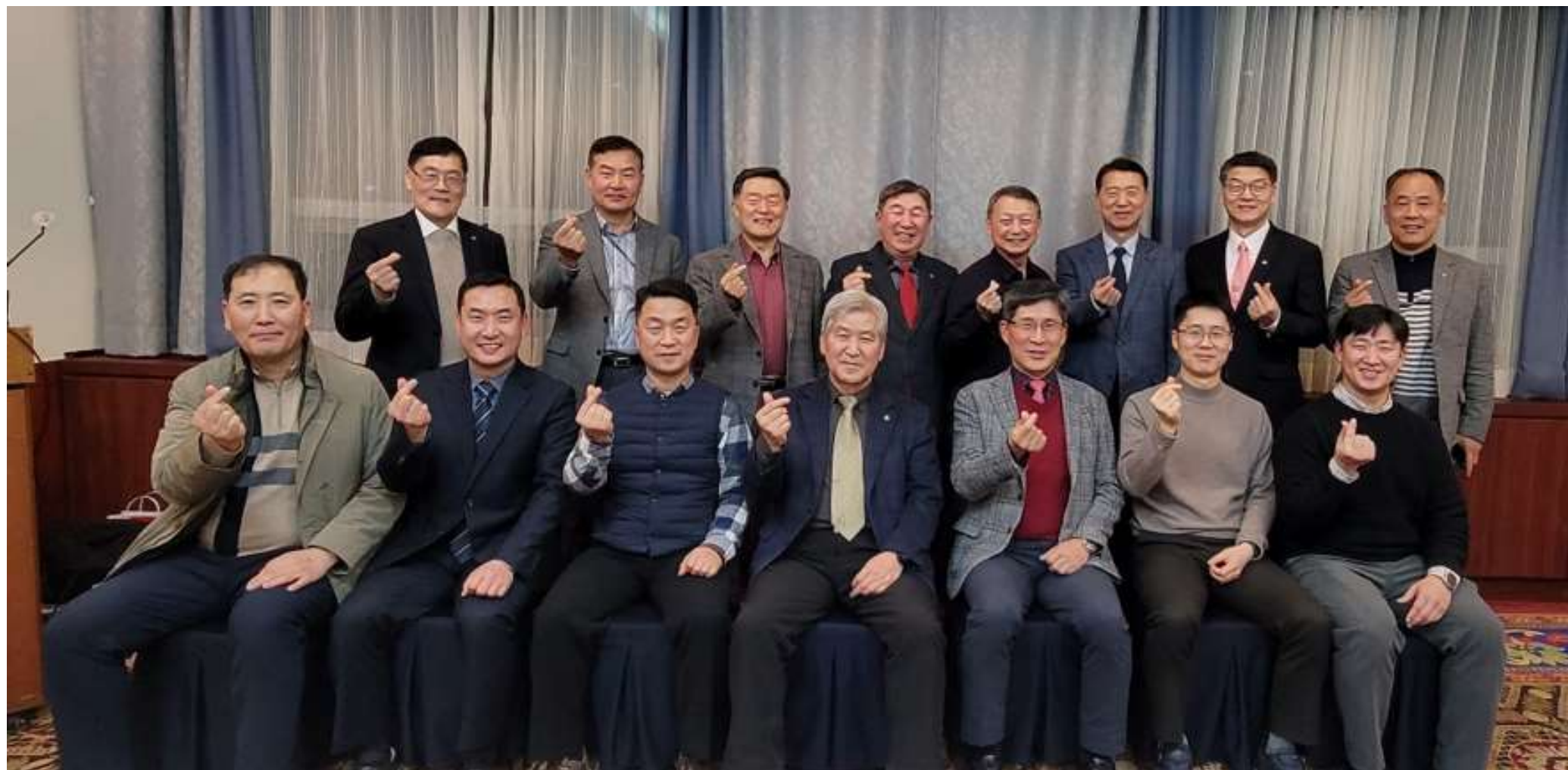
2024 기독교관 초청행사(2회): 2.22.목/ 공군호텔