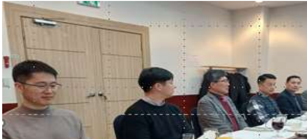
기독교관 참가자 소개