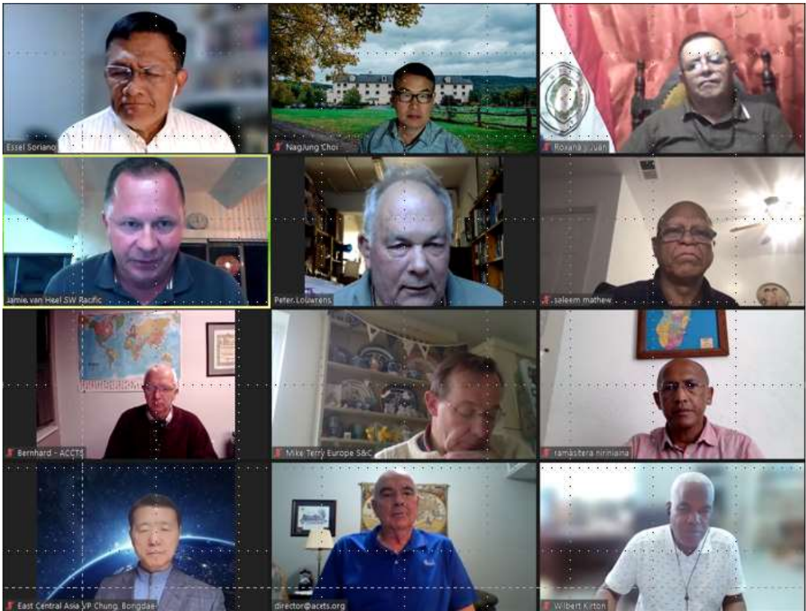
AMCF Watch & Pray Meeting(2.28.목/ 온라인)