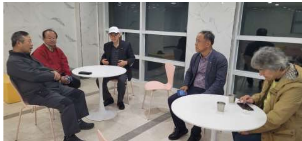
교육훈련국 인터랙션(4.26~27/ 엔케렘 수양관/안산동산교회)