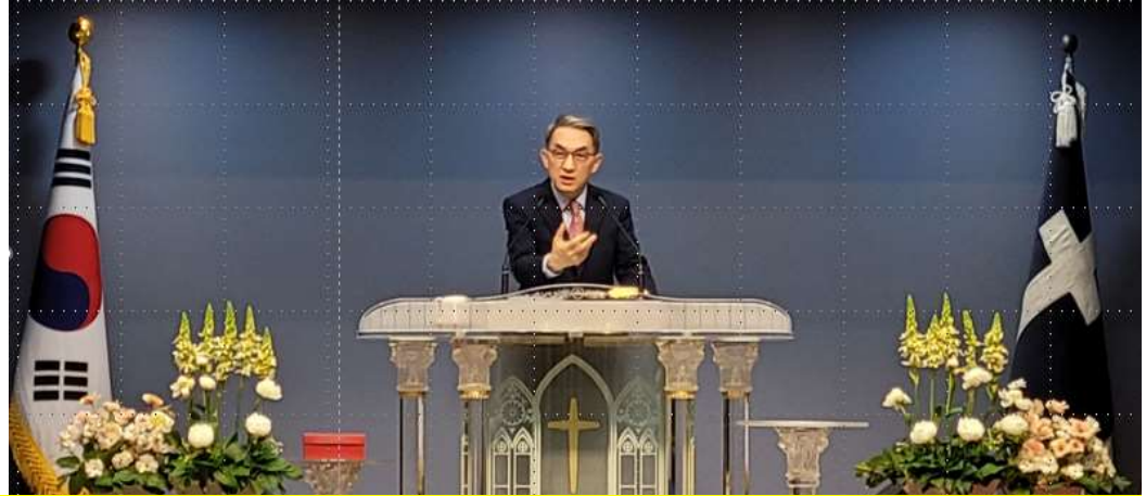
KVMCF 연합조찬예배 및 유관기관 협조회의(5.1.목 05:30/ 국군중앙교회)