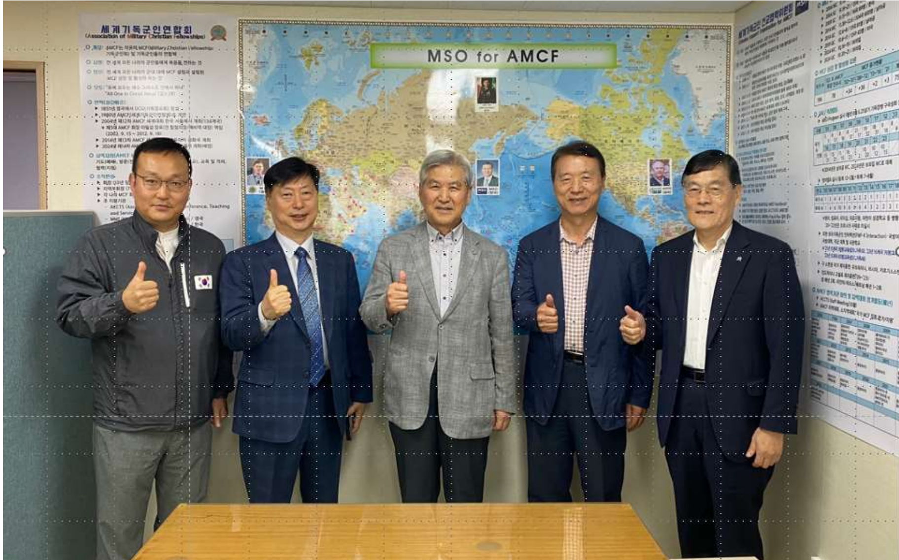
2007년 창설된 UNESCO 국제공식 등록단체 한국교회봉사단 임원 MSO 내방(6.11)