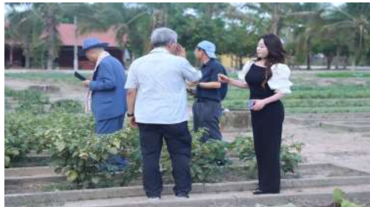
부대 영농장 방문