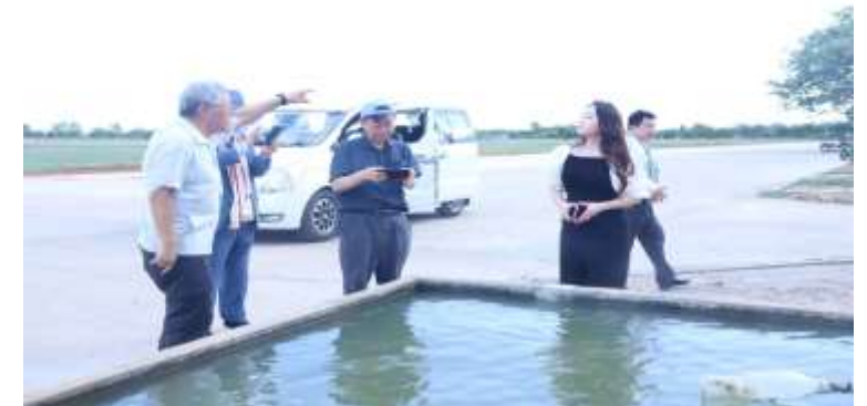
부대에서 사용하는 수질상태 확인