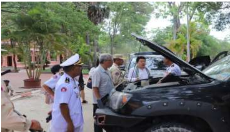
부대차량 연소장치 설치