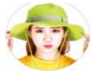
정글 사파리 성인·아동