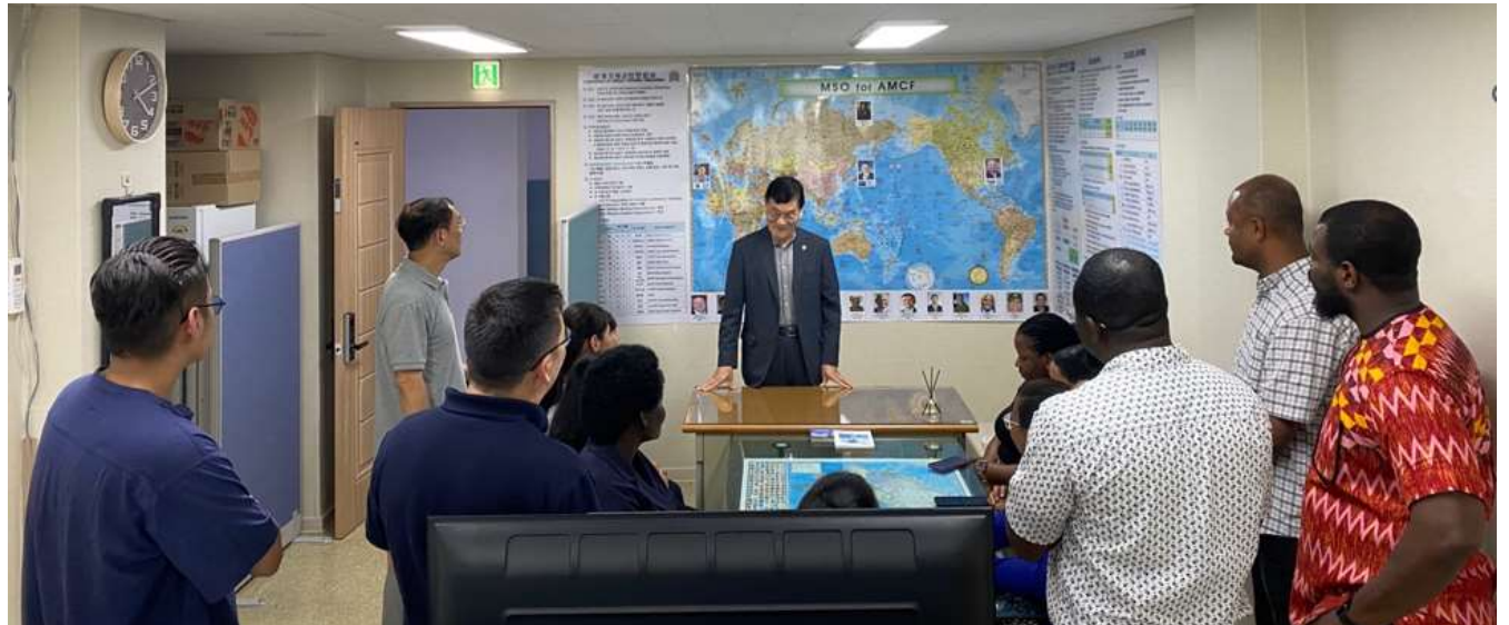
AMCF/ MSO 소개