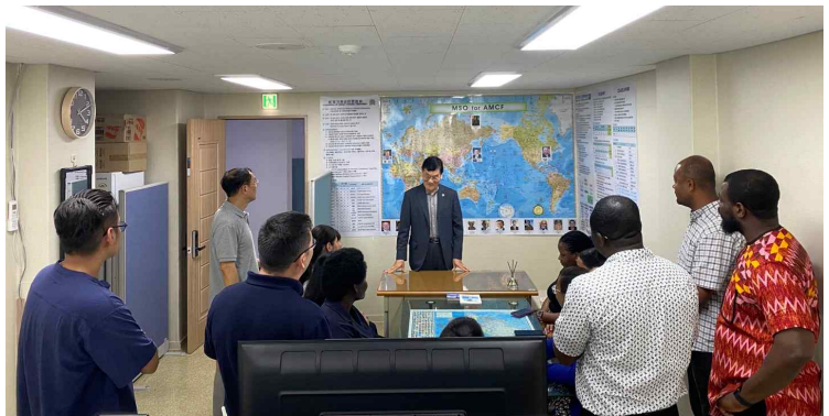
MSO 사무실 내방 (AMCF/MSO 소개)