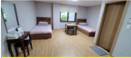
침대 2인실 44개 (1박 60,000원)