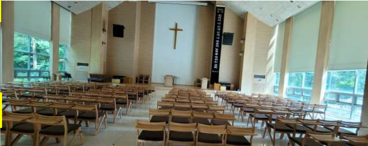
대강당은 별도 건물로 예배 및 교육장소: 1일 사용료 100만원