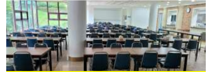
식당: 한끼 식사비용 7,000원