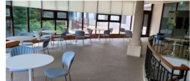
휴식 및 소그룹토의소