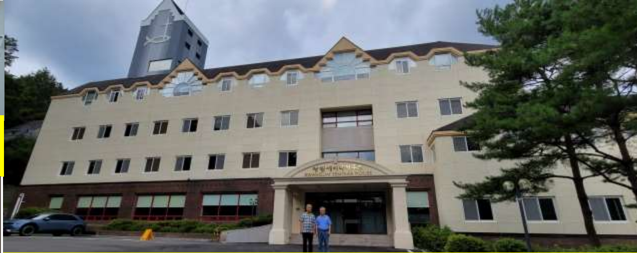
광림세미나하우스는 교육시설, 숙소, 식당이 포함된 5층 건물