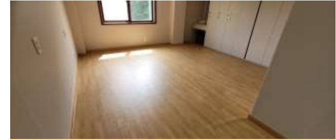
온돌 5인실 17개 (1박 120,000원)