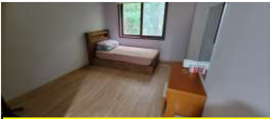
침대 1인실 17개 (1박 30,000원)