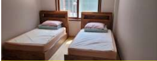
침대 2인실 (1박 50,000원)