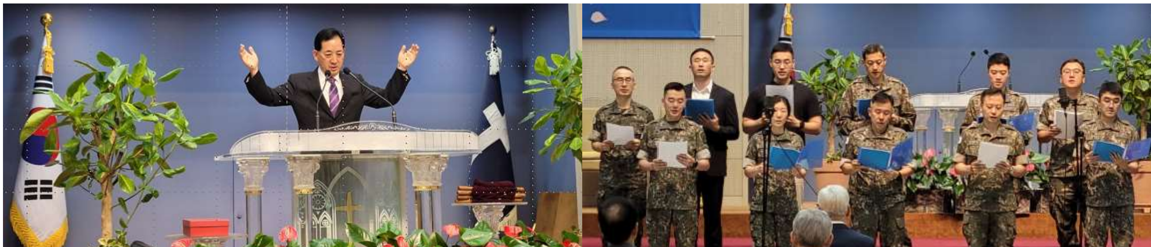
8월 7일 KVMCF / KMCF 연합조찬예배(국군중앙교회 대예배실)