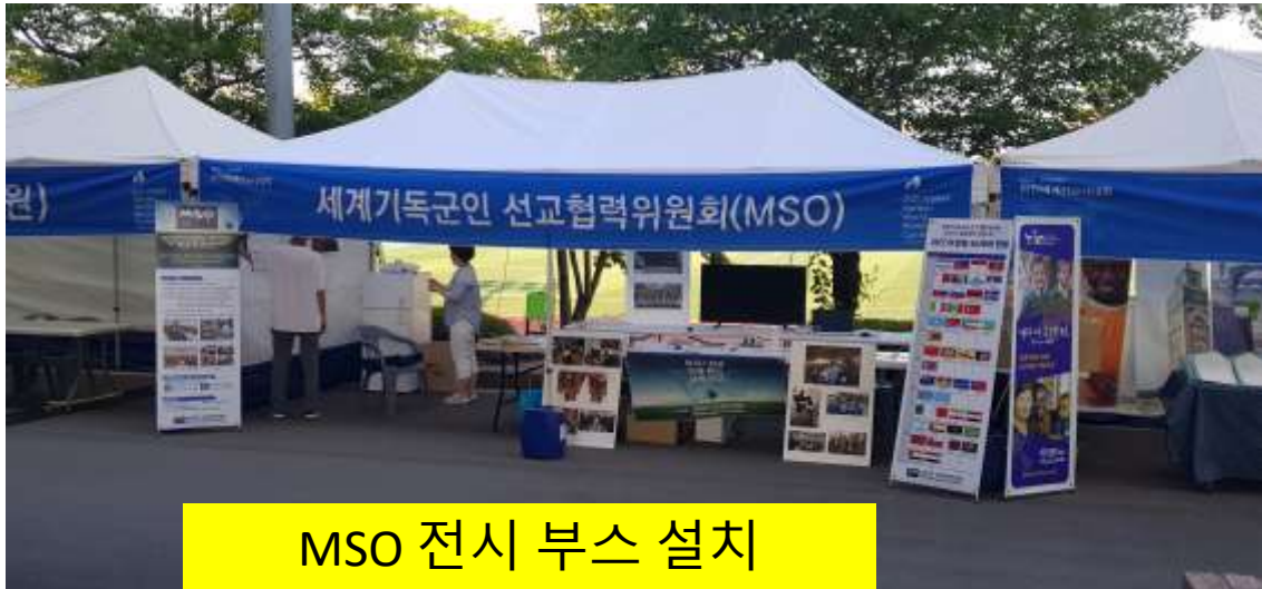
MSO 전시 부스 설치