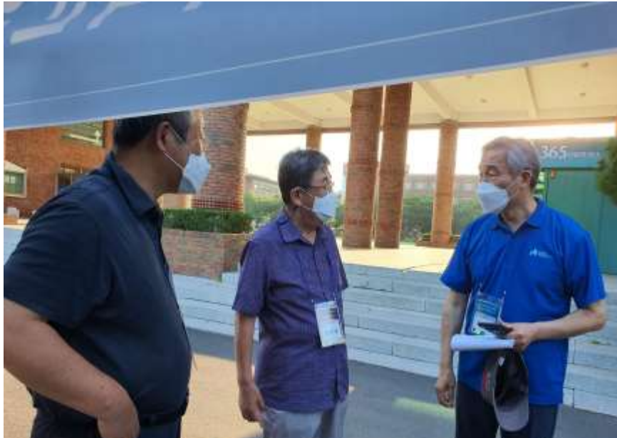
KWMF 최근봉 세계 회장 전시부스방문