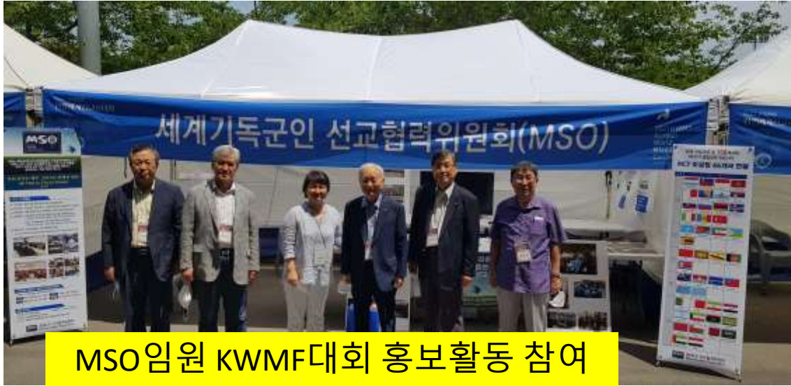
MSO임원 KWMF대회 홍보활동 참여