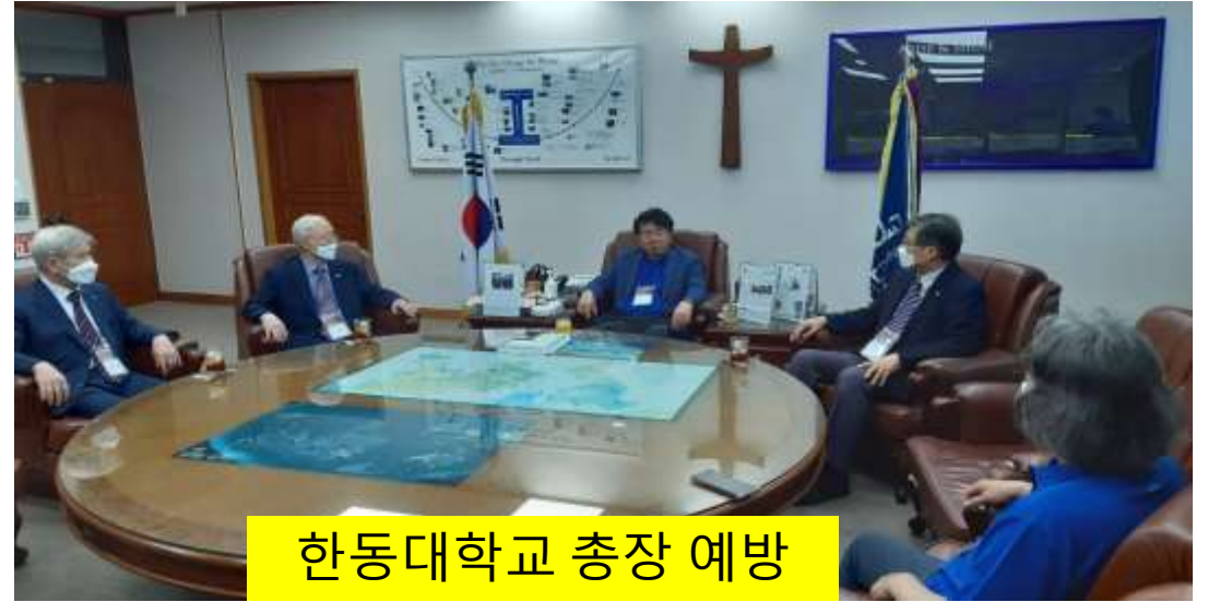
한동대학교 총장 예방