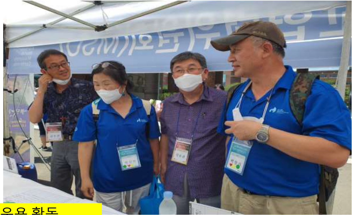
MSO 전시 부스 운용 활동