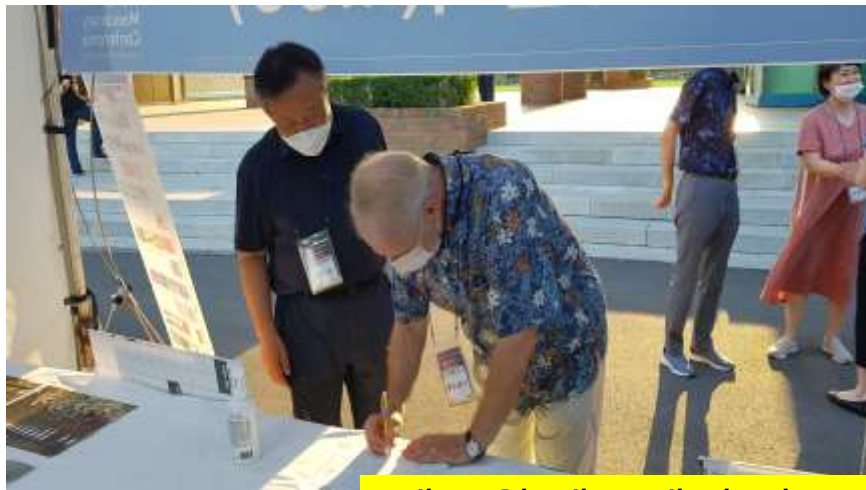
예수원 베토레이 신부