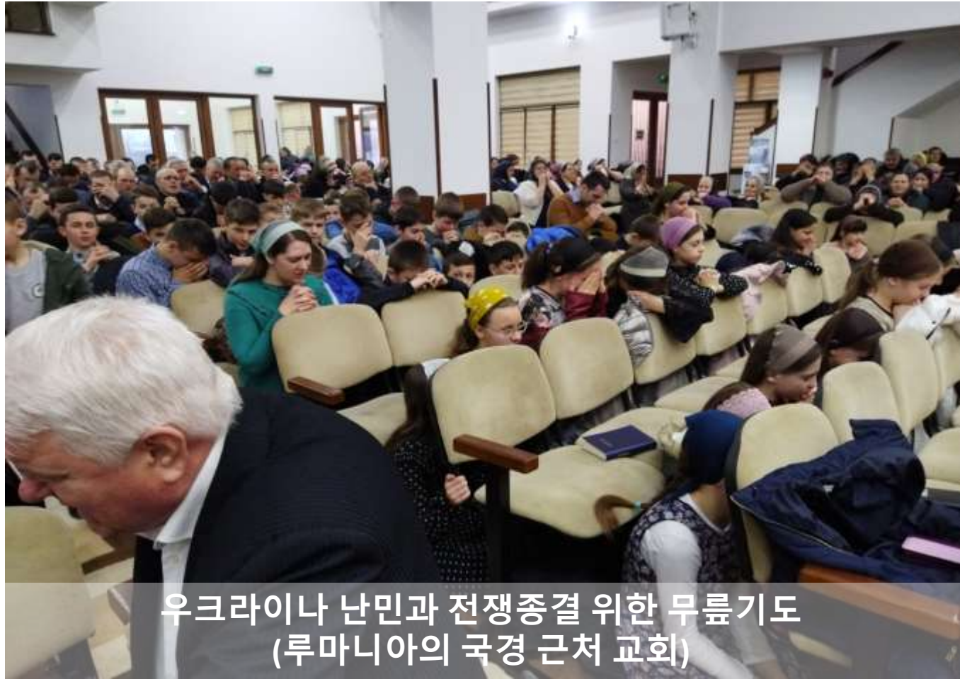
우크라이나 난민과 전쟁종결 위한 무릎기도 (루마니아의 국경 근처 교회)