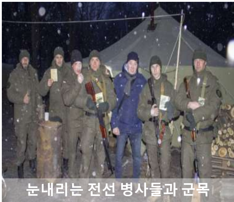
눈내리는 전선 병사들과 군목