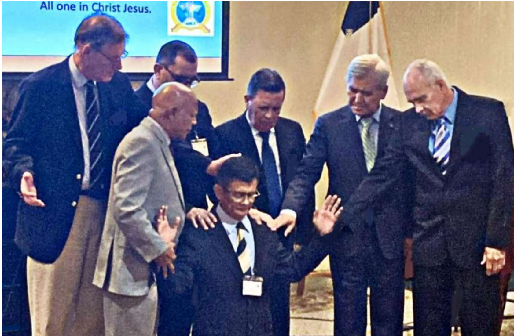
10.2일 AMCF회장 육군소장(예) Essel Soriano 장군을 위한 3PSO 대표기도 모습