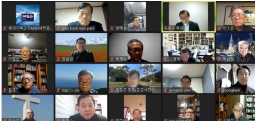
2022 종무예배 온라인 참가 43명