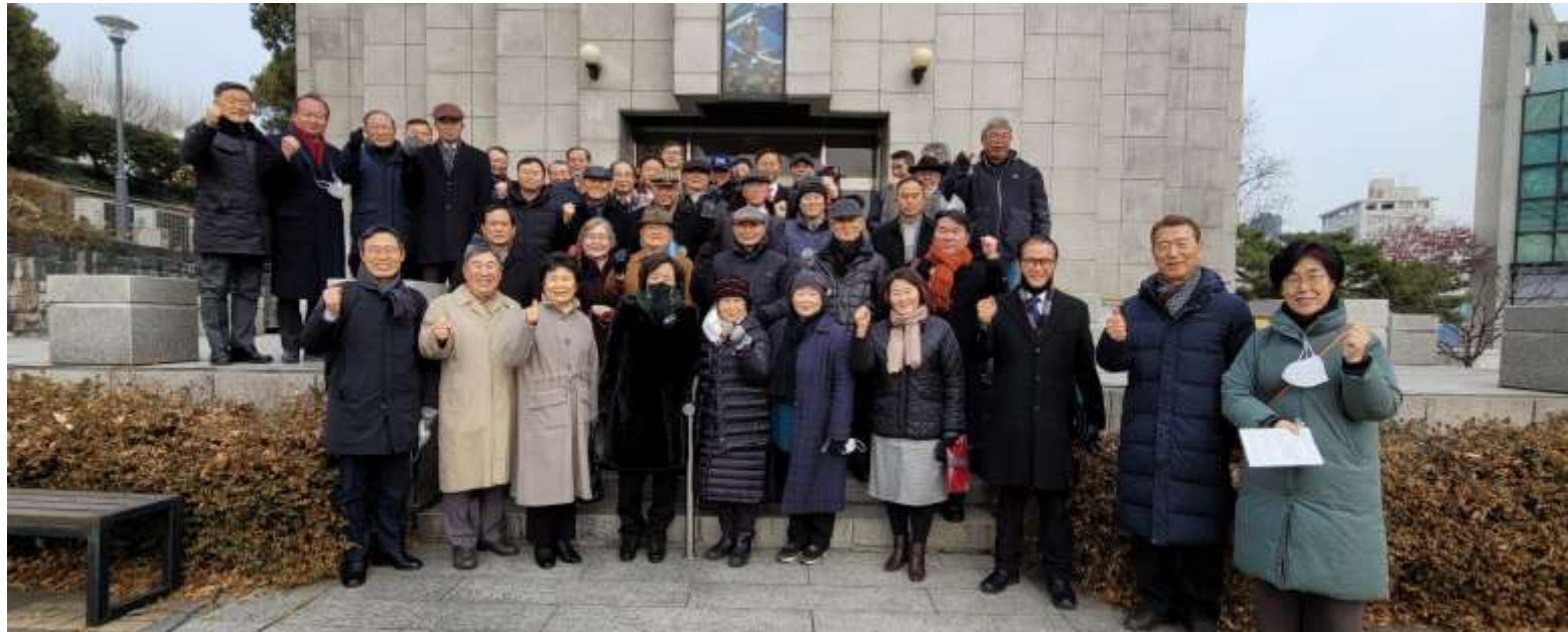
사무예배 57명 참석(선교기념관 앞)