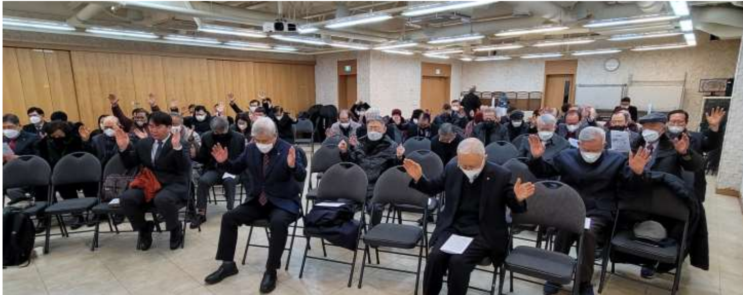
합심기도: AMCF/MSO 세계 군선교사역을 위해