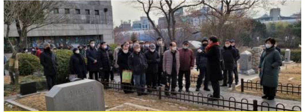
외국인 선교사묘원 순례