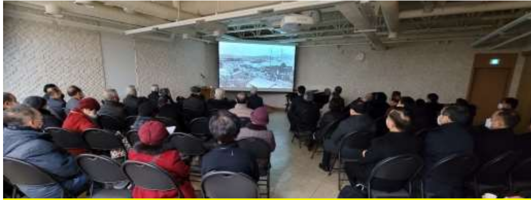
예배 후 양화진 소개 동영상 시청