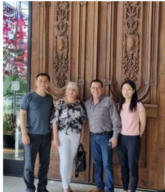
남미지역 VP 부부