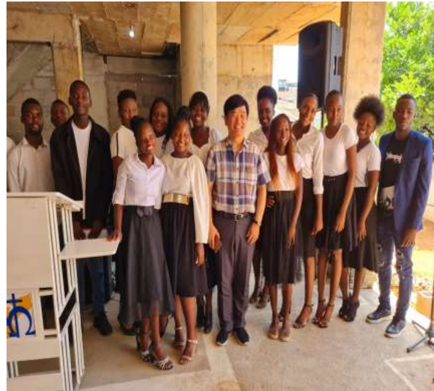
짓다만교회 찬양팀과 함께