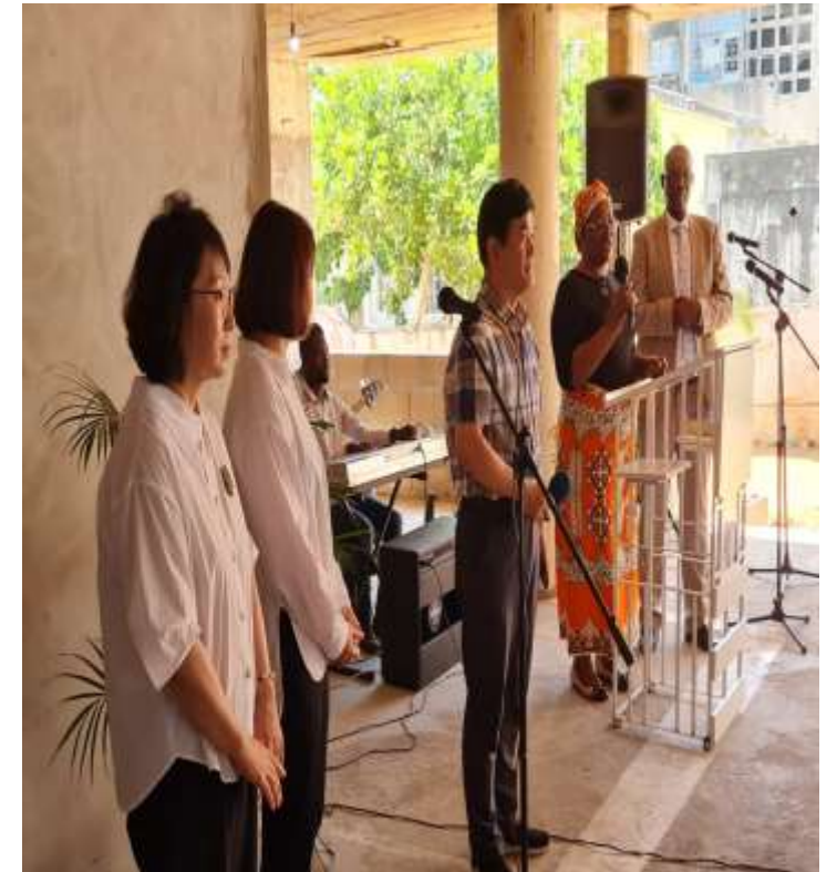
AMCF, MSO 사역활동소개