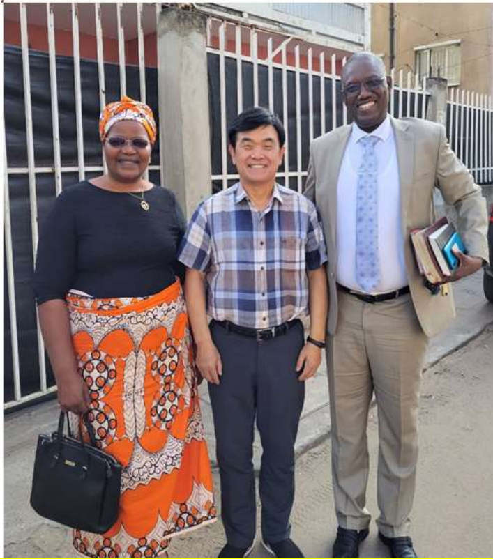
중령 펠리씨나 부부와의 만남