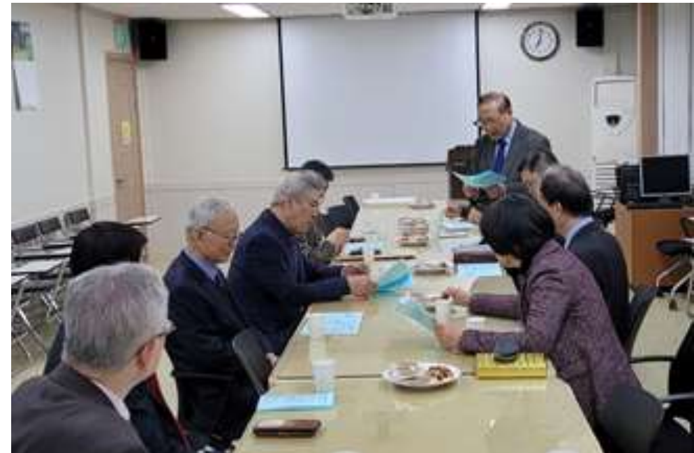
유관기관 협조회의(한국군종목사단 등 7개기관)