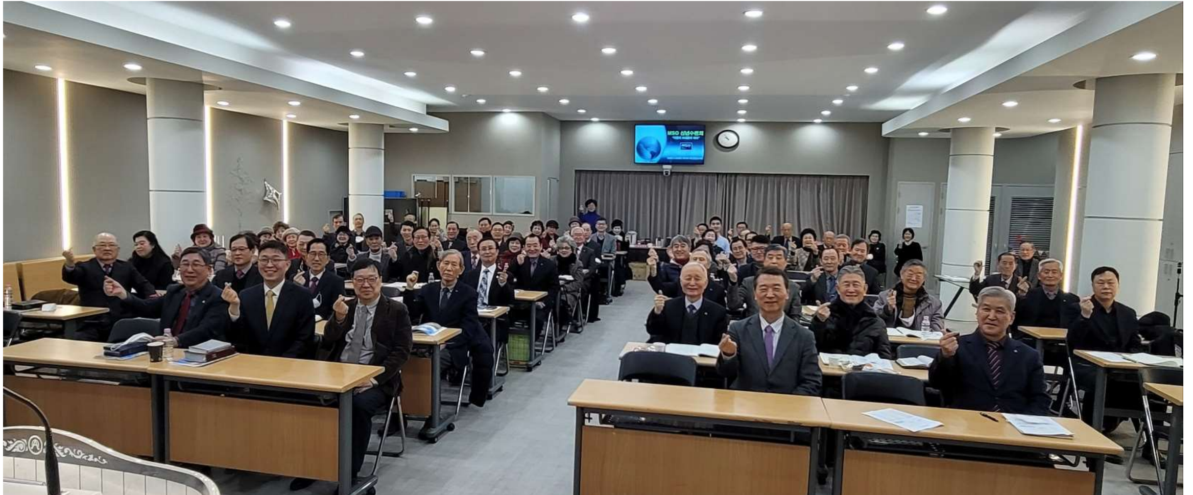
MSO 임직원 75명이 하나님의 사랑을 가지고 세계 군선교 비전에 따라 2023년 사역활동을 다짐하였습니다